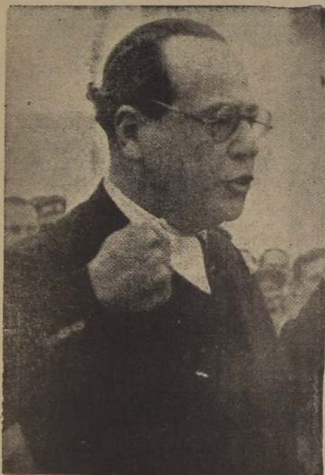
Don Juan Negrín, Presidente del Consejo de Ministros de la República.

A la República Española y a Chile, país de hombres libres y "ASILO CONTRA LA OPRESION"