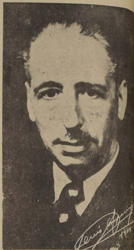
Luis Companys, Presidente de la Generalidad de Cataluña.

Pormenores: "TERRA" Huérfanos 1164 — Oficinas 41/42 Fono 62583