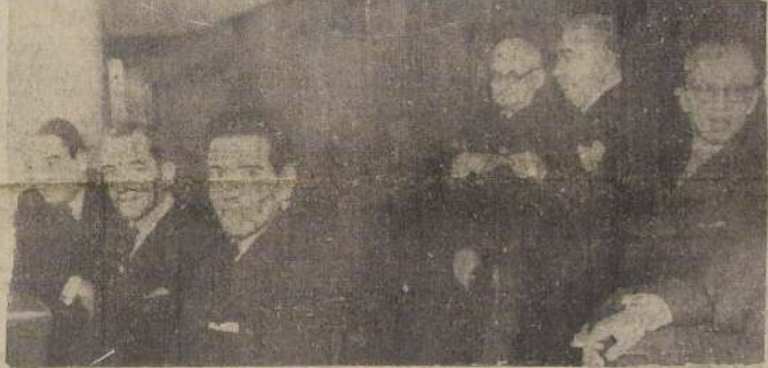
Tres aspectos del homenaje rendido ayer en el Congreso Nacional al Presidente Roosevelt: 1.º Ministros de Estado; 2.º Embajador Bowers y miembros de la Embajada de los Estados Unidos; 3.º Miembros del Cuerpo Diplomático