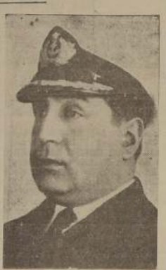
Contralmirante don Carlos Herrera Acevedo

Límite superior: Una recta de rumbo N 40° W, de 2.500 metros de largo, que corre entre el punto de partida y el punto de llegada, es el camino público.