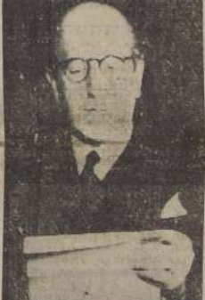
Ministro de Relaciones Exteriores, señor Joaquín Fernández