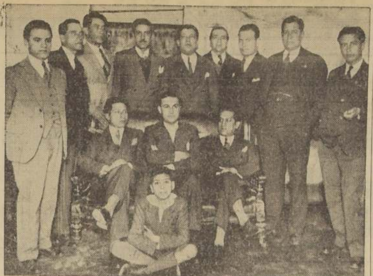
Actual directorio de la Sociedad Unión de Peluqueros, progresista y abnegada entidad que cumple 33 años de existencia. Se alanza en Santa Rosa 555.