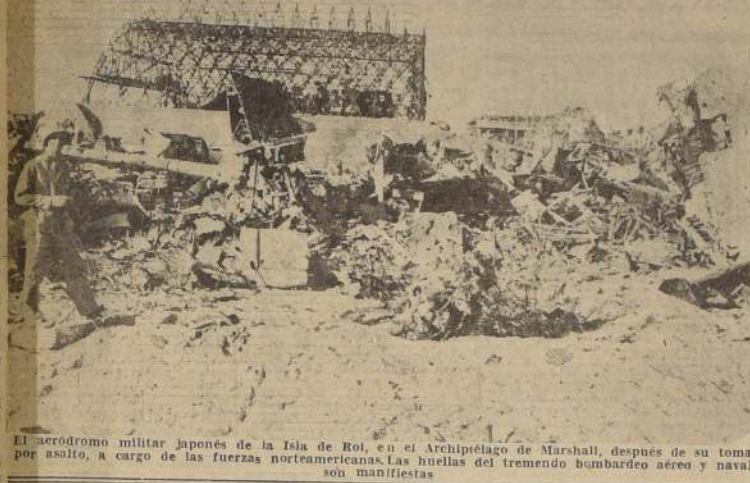
El aeródromo militar japonés de la Isla de Roi, en el Archipiélago de Marshall, después de su toma por asalto, a cargo de las fuerzas norteamericanas. Las huellas del tremendo bombardeo aéreo y naval son manifiestas.

FUERZAS DE E. U. ESTAN LUCHANDO EN FRENTE DE BURMA