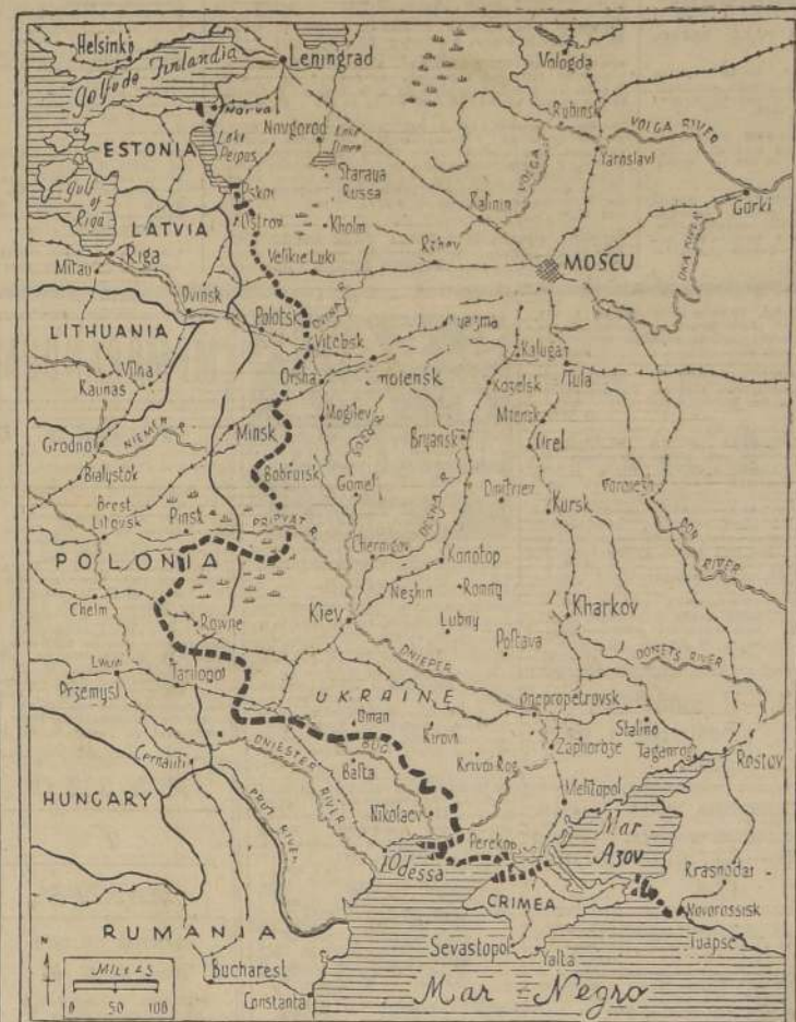
Los nazis han lanzado una de sus más importantes ofensivas en el frente sur, donde han cortado el ferrocarril que va a Odesa, hasta Varsovia. Considerables fuerzas alemanas al este del Dniéster. La línea cortada marca, aproximadamente, la situación actual del frente.

LEJANO ORIENTE: En el frente de Arakan en Birmania hubo poca actividad. Los japoneses dispararon contra las posiciones británicas al norte de Buthidaung. Aviones de la decimocuarta fuerza aérea norteamericana en China avistaron de 47 a 67 aviones japoneses y hundieron dos buques.