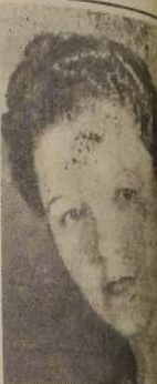
Rt. Hon. Elena L. de W. cuyo regreso a Inglaterra anuncia para una fecha próxima.

A las 10 horas de hoy se efectuará en la Sala Cervantes la exhibición privada de la extraordinaria producción cinematográfica española "San Ignacio de Loyola". Como ya se ha informado, esta soberbia muestra filmica que Columbia Pictures estrenará el martes 4 de abril próximo simultáneamente en los teatros Santa Lucía y Continental, es una película ampliamente recomendada por S. S. el Papa, y en ella se hace una narración simplemente magnífica de la vida del fundador de la Compañía de Jesús, con aspectos de indiscutible interés sobre la existencia del noble caballero del héroe y del santo que fue don Inigo de Loyola. La exhibición privada que se efectuará hoy en la mañana en la Sala Cervantes está dedicada especialmente a las autoridades civiles y religiosas, dirigentes de instituciones católicas y a la prensa. Sobre el particular cabe hacer presente que S. E. Revdima, el Cardenal Dr. don José María Caro ha concedido autorización para que el clero asista a dicha exhibición.