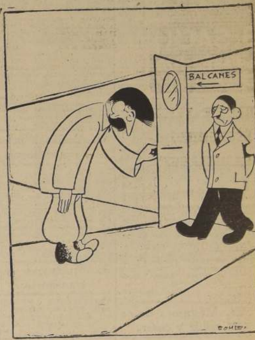
—Pase el padrecito de todos los pueblos

El acto electoral del domingo último demuestra que tanto Derechos como Izquierda disponen en Chile de los dos medios legales para hacer valer sus aspiraciones para llevar hasta las masas su doctrina y para ese fin estas una aceptación o rechazo formulado libremente en forma de voto en nuestra Carta Fundamental. En un ambiente de tal especie no hay sitio para perturbadores ni para caudillos.