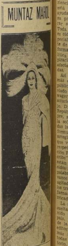
La Princesa Kelladze, se ve aquí en su traje como Mahal, en el gran festival celestial en Nueva York, en la noche del 34.º cumpleaños del Presidente Roosevelt.