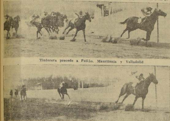
Tintorera precede a Patino, Mauritania y Valladolid

go lo dominó para irse fácil al disco sin enemigos. Viéndose asopadamente la pupila de Juan Cavieres, siguió hasta la meta en la cual se anotó cuerpo y medio sobre Visto Está, que avanzó por un cuerpo a Paracelo. Cuarto, Porcena y quinto Armando Rosca, delante de Telemaco y Rusticano. Último, Cuernavaca y Rusticano. No corrió Indio Manso. La prueba final fue un estrecho triunfo para Americanita, que escasamente batió a El Mamano. En buen momento vino la orden del juez y fue El Mamano el primero en destacarse al frente seguido de Eucalipto, Precursora, Americanita y Corno se Pide, quedando Groenlandia y Feroz al fondo. En los 600 metros Precursora avanzó al segundo puesto y siempre con El Mamano en punta llegó al lote a tierra derecha. Frente a las galerías Americanita—por fuera—presentó lucha al puntero que opuso tenaz resistencia. En repida lucha siguieron ambos rivales hasta el disco y solo después de grandes esfuerzos pudo Americanita batir en la meta a El Mamano por media cabeza. El tercer puesto lo obtuvo cuerpo lo obtuvo Vinagre, delante de Caka, que resultó al favorito. Quinto Como se Pide, sexto Precursora y séptima Groenlandia. Último Feroz. No corrió Doña Cucha.