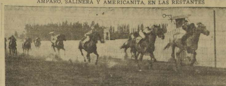
Larache vence de punta a punta a Rosamunda, Sierra Madre y Melilla

Dada la señal de partida El Sirdar tomó la delantera seguido de Tántalo, Ranquelero, Mauricie, Royal Master y Sin Saber, que era el último del pelotón. En ese orden pasaron por primera vez frente al disco, pero poco antes de llegar a la tierra derecha opuesta Tántalo forzó el tren y dominó luego a El Sirdar tomó luego dos cuer-