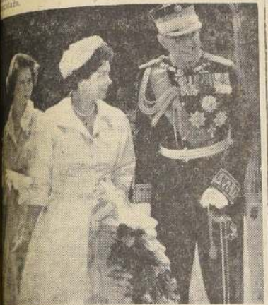
Palacio Real de Grecia durante un acto oficial. Los soberanos muestran del cariño y respeto de su pueblo, que ven en ellos la encarnación del sentimiento helenico.

"Se estima que los proyectos industriales y turísticos ya en ejecución producirán una ganancia de alrededor de 60 millones de dólares en divisas y un aumento de 35 al 110% en las entradas de las industrias correspondientes."