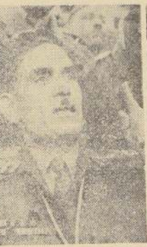
GENERAL ABDUL KARIM KASSEM

Aviones franceses están dejando caer en paracaídas tiendas, alimentos y vestidos a otras tribus del desierto que no pudieron llegar a los centros de socorro.