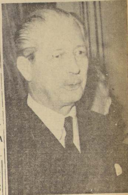
PRIMER MINISTRO HAROLD MACMILLAN

Las consultas giraron en torno del proyecto de respuesta que redactaron el Presidente Eisenhower y el Primer Ministro británico Harold Macmillan durante la visita que hizo éste a Washington a fines de la semana pasada.