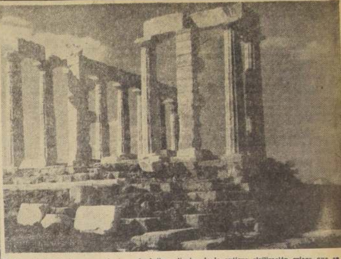
El Templo de Neptuno, una de las más bellas reliquias de la antigua civilización griega que se levantan desafiando la acción del tiempo y como ejemplo de lo que pudo hacer esa raza fuerte y estudiosa.

Se ha confiado también al señor Economou la instalación de una fábrica de fósforos, madera terciada, "hardboard" y cañones para embalajes. Esta industria constituye el primer paso hacia