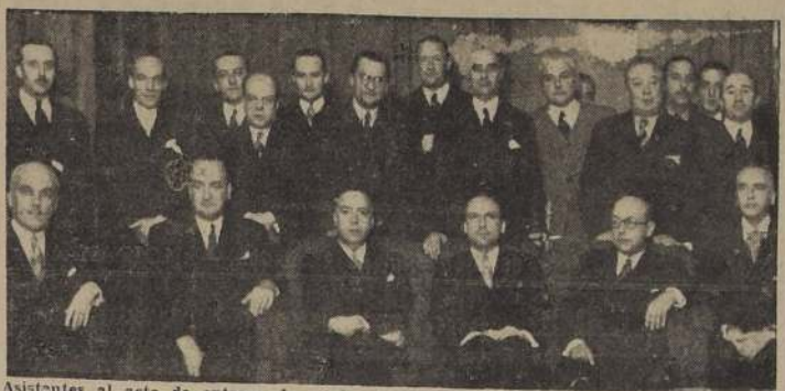
Asistentes al acto de entrega de condecoraciones en la Legación del Ecuador