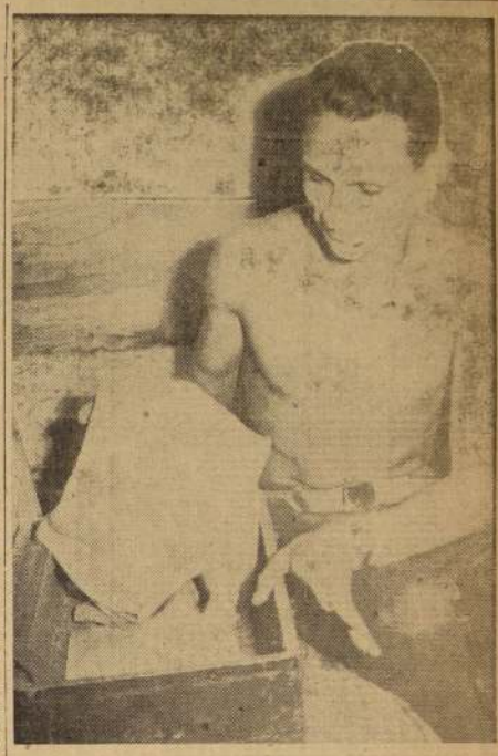
RECORDMAN SUDAMERICANO. — Aris, Panambé, especialista del Brasil, es sorprendido por el lente de LA NACION, cuando abre sus maletas al día en que llega a Santiago. Con su cordialidad de siempre manifestó que venía dispuesto a demostrar sus condiciones, aunque con una marca que se esperaba, pero que seguramente —adelante— podría mejorar o incluir un 8. Su record es de 7.84 metros.

MUY BIEN durmieron los atletas brasileños, en su primera noche en la acogedora "Santiago". Los varones en el Hotel Claridge, de la calle Ahumada, y las damas, no muy lejos, en el Hotel Ritz, de calle Estado.