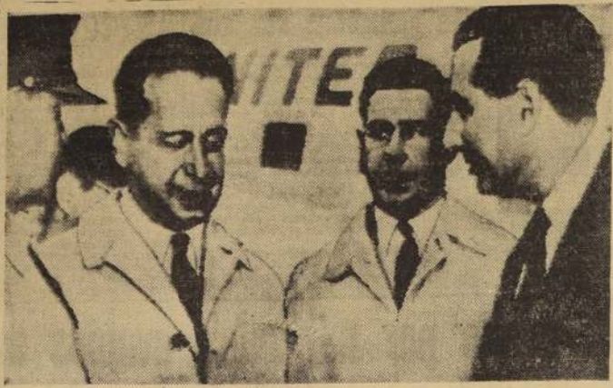
TEL AVIV, Israel. — El Secretario General de las Naciones Unidas, Dag Hammarskjöld (segundo de izquierda a derecha), conferencia con el mayor general E. L. M. Burns, (izquierda), supervisor de la NU, para la tregua en Palestina, y con el representante de Israel en la organización internacional, Hammarskjöld, en un momento de la conferencia.