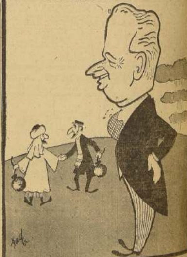
DAG HAMMARSKJOLD. — Secretario General de la Organización de las Naciones Unidas, que, tras una breve visita a Santiago, viajó a El Cairo. El funcionario máximo del organismo internacional realiza activas gestiones con miras a evitar el tercer mundo, hasta convertirse en una seria amenaza para el mundo, la explosiva situación que se ha creado en el Medio Oriente, y que ya se ha manifestado en sangrientos choques entre egipcios e israelíes.