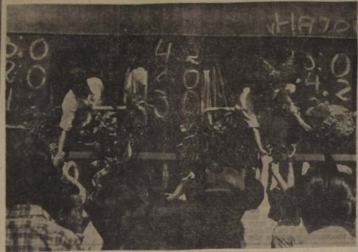
REGRESO DE UNA JIRA. — Los aficionados de Belgrado reciben en triunfo a los integrantes del Hajduk, después de una jira en que sólo cosecharon victorias. Obsérvese que en el vagón que los conduce están anotados con tiza los scores de los diversos encuentros sostenidos.

Las inscripciones para el campeonato se cerrarán mañana, para proceder a la confección de la "lista" de jugadores del primer día. Mañana se cerrará también la cancha de golf de Santo Domingo hasta las 8.30 horas del viernes, cuando jugarán su primera pelota los integrantes del primer grupo de competidores. Es muy probable que este año, en consideración a la magnífica actuación de los "fairways", no se use el "tee-up" ya que no pocos jugadores que han estado en Santo Domingo, estiman que ya no es necesario.