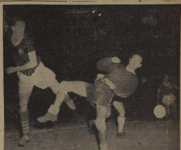
torneo, careciendo eso sí de fortuna en los remates. Además, le perjudicó abiertamente el arbitraje del señor Rimmel-Latorre.