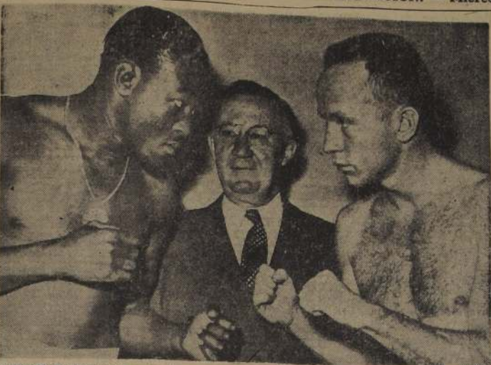
CAMPEON Y ASPIRANTE. Frente a frente, mirándose fija, aunque no amenazadoramente, están Kid Gavilán, campeón mundial de los mediodios, y Chuck Davey, temible aspirante a la corona. Las apuestas favorecen en razón de 12 a 5 al campeón cubano; pero el challenger asegura que vencerá, contra todas las predicciones, por K. O. antes del décimo asalto. A modo de árbitro de la pose, está el presidente de la Comisión de Boxeo de Illinois, Mr. Livingstone Osborne.

El título de Gavilán está en juego en esta pelea, que se celebrará en un momento crucial. Los apóstoles de Gavilán han expresado que este tiene dificultades para hacer el peso de 147 libras, pero no le permiten que vaya al campeón pesas. El presidente de la Comisión de Illinois, Livingston, ha advertido a Gavilán que si no logra bajar de peso, será despedido de su equipo.