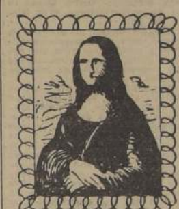
La Gioconda (de Leonardo) una obra maestra de la PIN-TURA

El Comité informó que solamente 48 de 704 productos químicos que ahora se añaden a los alimentos, son conocidos como definitivamente seguros.