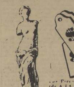
La Venus de Milo una obra maestra de la ESCULTURA