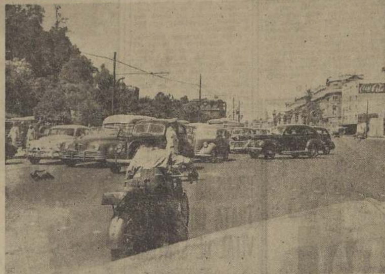
CONFUSION DEL TRANSITO EN LA ALAMEDA.—En el sector desguarnecido de la Alameda, entre Plaza Baquedano y San Antonio, continúa la confusión del tránsito. Cada día se impone la construcción de los refugios, a la cual LA NACION insistió durante todo el año 1950. En el grabado, frente al centro Santa Lucía, los carabineros deben realizar prodigios para controlar el cruce de los numerosos automóviles, troleibuses y microbuses que en diferentes direcciones se disputan la calzada.