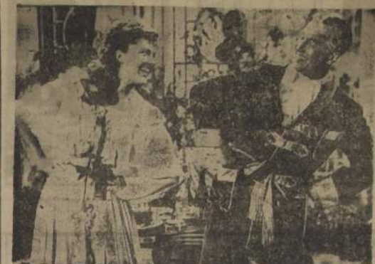
Una escena de "El Rey", producción de Leo Films, que estrenó hoy el cine Bandera. Maurice Chevalier baila y canta con Annie Ducaux, una bella parisina.

El humor, la fantasía, el amor y la picardía típicamente francesas se combinan en la chispeante comedia "El Rey" de los autores Robert de Flers, Chevalier y Arène. Llegada al cine con Maurice Chevalier de protagonista, y que Leo Films estrenará hoy en el Bandera. La obra en que se basó el film Annie Ducaux y Sofía Desmarets encarnan a las dos bellas mujeres que se disputan al soberano de un reino europeo cuando llega a Francia en misión de Estado. El Rey prefiere el amor a las intrigas políticas y a firmar tratados, y pronto se le ve cantando alegres canciones y perseguido por celosos maridos. Chevalier eligió la obra en que se basó el film entre cuarenta argumentos que le fueron presentados al regresar a París después de varios años en Norte América.