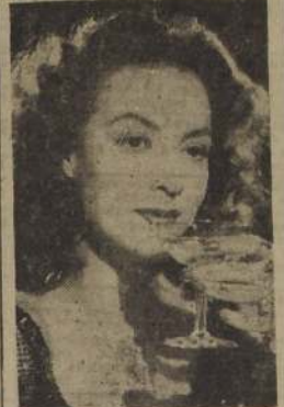
La bella María Félix, a quien veremos en el cine Rex en "Mare Nostrum".

"Mare Nostrum", la obra del celebrado novelista español Vicente Blasco Ibañez, ha sido llevada a la pantalla con fidelidad, y María Félix logra en su trabajo un triunfo por su actuación al público conquistando a caporal un triunfo por su trabajo artístico. "Mare Nostrum" se presenta en el cine Rex, precisamente, donde habrá la oportunidad de apreciar la realización de esta película basada en la novela del escritor Vicente Blasco Ibañez.