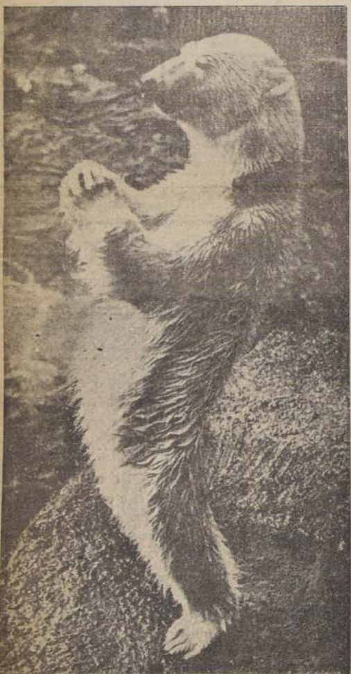
Casi están demás todos los comentarios acerca de este oso que toma una actitud bien aristocráticamente premeditada ante la máquina fotográfica.