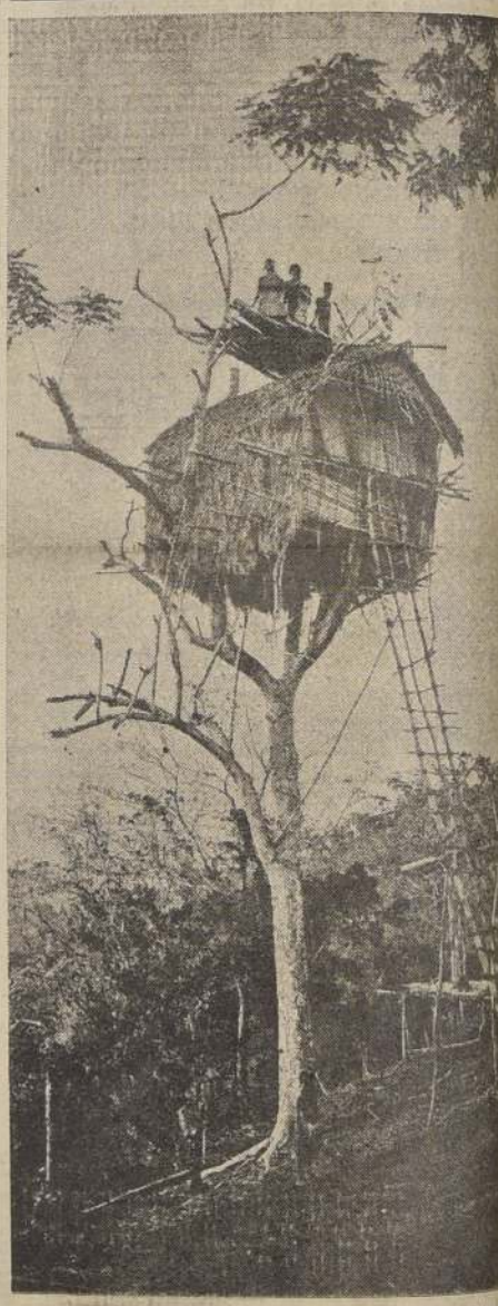
Nativos de Nueva Guinea se fabrican estas curiosas viviendas, a las cuales suben por una larga escalera, puede suponerse, son bastante ventiladas.

La sal marina, pues, obra como un veneno. Es un hecho. Es un fenómeno de la vida.