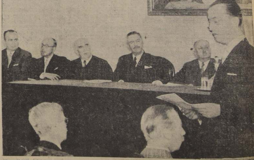
Mesa directiva del homenaje de ayer, en el cincuentenario de la muerte de don Miguel Luis Amunátegui. — El Rector de la Universidad leyendo su discurso. — (Información página 12)