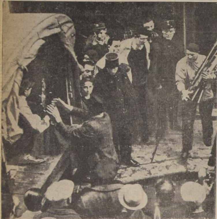
La policía francesa, durante uno de los numerosos allanamientos a las guaridas de los "cagouards" hace una recolección de armas.