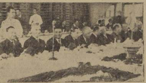
Mesa de honor, presidida por S. E., en el banquete de ayer.

A continuación se realizó con toda solemnidad una ceremonia en el Mausoleo del Cuerpo de Carabineros, en el Cementerio General, destinada a recordar a los miembros de la institución fallecidos en actos del servicio. Una delegación integrada por