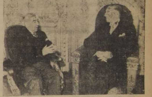
El primer Embajador de Venezuela, conversando con el Excmo. señor Ríos