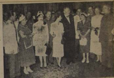
Un aspecto del almuerzo ofrecido ayer en la Moneda por S. el Presidente de la República a jefes y oficiales de la Guarnición de Santiago, con sus respectivas esposas

COMIDA CURSO MILIT DEL AÑO 1927. — Mañana efectuara en el Club Militar las 21.30 horas, la comida del Curso Militar del año 1927. Ha organizado con motivo cumplir 25 años servidos en Institución. Han sido invita- a esta comida los profesores instructores con sus respecti- esposas.