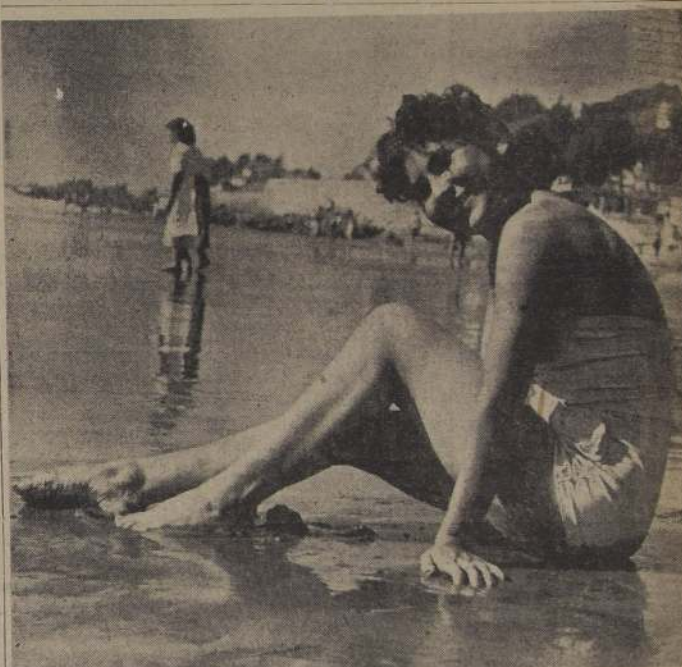
BELLEZA MORENA AL SOL Y AL VIENTO. — Sobre la playa, frente al mar, la bañista resume una expresión de juventud y belleza, que parece agilizarse desde la foto para ir al encuentro de la emoción colectiva del lector. Algo que alegra el corazón de todos habita ahora en todas las playas de Chile. Es la juventud y la deportiva belleza de sus mujeres, como un mensaje de claros optimismos, que recuerdan los veranos de Estratón: "A la orilla del mar, sobre la playa, una niña se saba, tendió al sol".