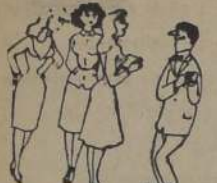
—¿Se adhiere usted a nuestro movimiento?... —De mil amores...

Los negros de Santo Domingo suelen emplear este refrán: El perro tiene cuatro patas, pero no puede andar a la vez cuatro caminos.