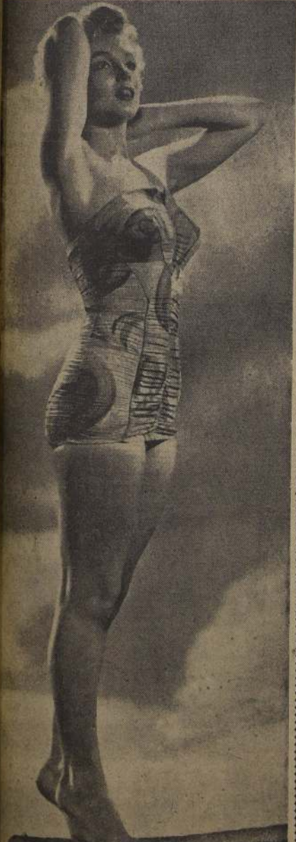
MARYLIN MONROE, probablemente la muchacha más fotografiada de hoy día, ha obtenido una popularidad que ha hecho de ella una de las estrellas de gran atracción taquillera. Es coestrella en la producción de Wald-Krasna para la RKO Radio. "Tempestad de Pasiones", junto con Barbara Stanwyck, Paul Douglas, Robert Ryan y Keith Andes.