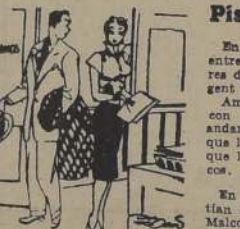
—Si consiga que me autoricen este préstamo, monada, ¿quiere usted cenar conmigo esta noche?...