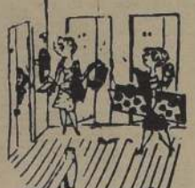
—Es para usted, señorita Garibay...

Un oficial en servicio activo en el ejército egipcio se dirigió algo airado al general Neguib, actual jefe del gobierno, a raíz del golpe de Estado que destruyó al rey Faruk, rogándole que le liberase de su mujer de tendencia despotica. —Usted, que ha libertado a Egipto de un tirano —escribió el oficial— ayúdame ahora a mí a liberarme de esta dictadora absoluta.