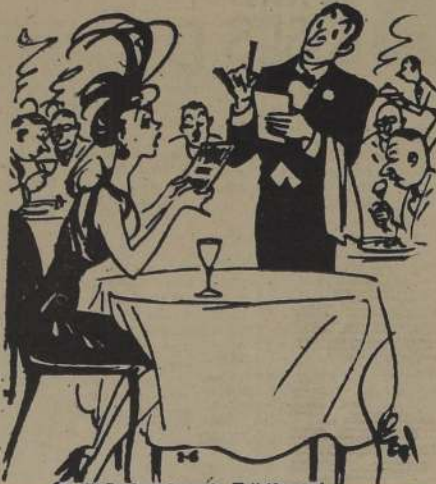
—Estoy a dieta, vengo sola y sólo traigo cinco pesos... ¿Qué me aconseja usted que pida...?

El médico de una reina de Francia, el doctor Malouin, tenía tanta confianza en su arte como puede tenerlo un matemático en la geometría. Asistió en su enfermedad a un literato célebre, a quien recibió bastantes cosas; el paciente las tomó todas con exactitud; al fin curó, y el médico le dijo, dándole un abrazo: —Muy bien, amigo mío! Solo digno de estar enfermo.