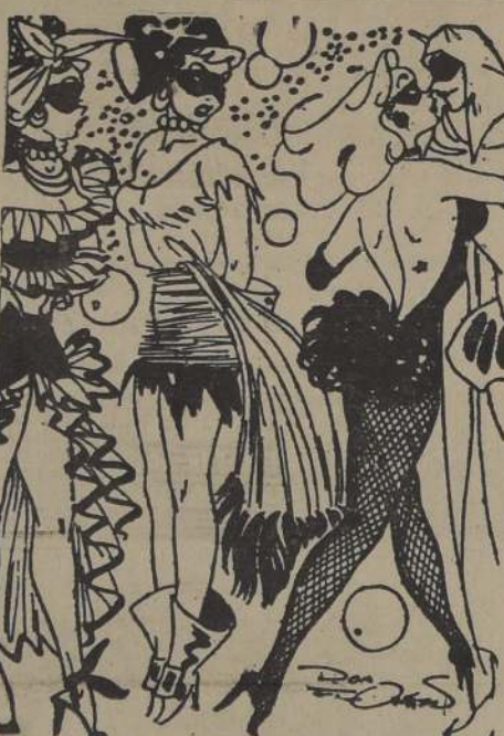
—Sea quién sea, trae el mismo disfraz del año pasado...