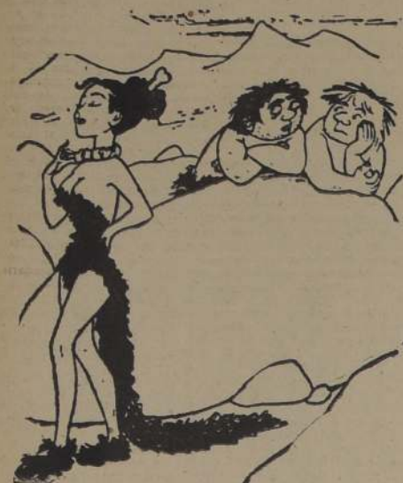
—Si es bella; pero la encuentro muy sofisticada.