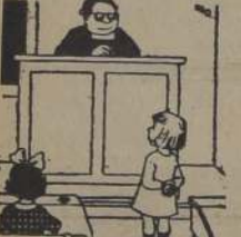
—¿La avaricia, profesor?... Cuando un señor no quiere pagar un helado...