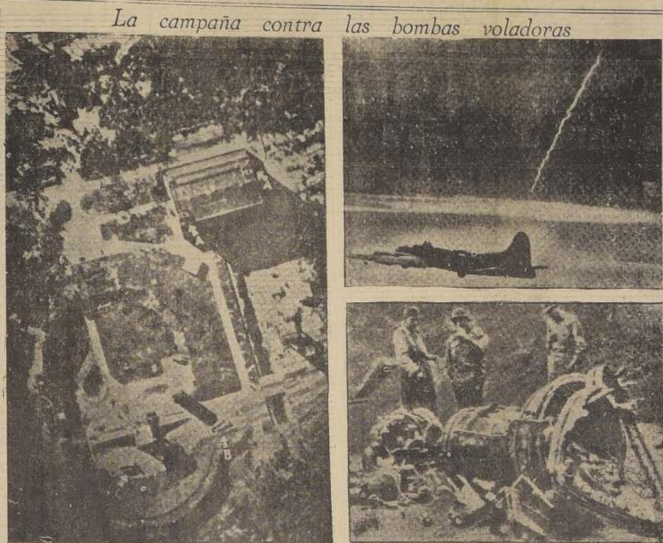
La campaña contra las bombas voladoras

El grabado de la izquierda muestra una base de lanzamiento de bombas V-2, fotografiada desde un avión aliado. Las flechas indicadas con la letra A, señalan la presencia de baterías antiaéreas; la flecha B señala el dispositivo lanzacohetes, y la C, dos bombas voladoras posadas en tierra. Arriba, a la derecha, puede observarse el trazo encendido que dejan a su paso estos temibles y ultramodernos proyectiles. Las bombas V-2, a causa de su vertiginosa rapidez, no pueden ser atacadas en el aire como las V-1. Los aviadores aliados han sido veras surcos del espacio a manera de cometas o de exhalaciones. Es por demás difícil distinguir desde el aire los emplazamientos desde donde son lanzadas, debido a que se encuentran cuidadosamente mimetizadas y protegidas por baterías antiaéreas móviles. La táctica de los aliados para neutralizar esta arma futurista, consiste en mantener constantes patrullas aéreas de bombarderos sobre las fábricas que las producen y sobre los sitios de lanzamiento.