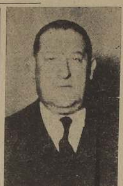
Pérez será recibida con satisfacción en los círculos comerciales, sociales y periodísticos de la capital a la cual se estrechamente vinculado.