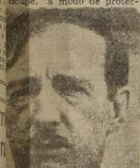
AHMED ZOGU DE ALBANIA

PARIS, 4. (U. P.).— Informes diplomáticos llegados ayer d'Oraay hablan de la posibilidad que el ejército italiano, "a modo de protección", Albania dentro de 48 horas, a fin de contrarrestar el estrechamiento del eje italo-alemán.