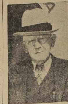
Gobierno de los Estados Unidos