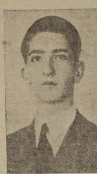
REY PEDRO DE YUGOSLAVIA

ambas potencias se comprometen a observar el "statu quo" y la soberanía nacional de los territorios del área del Mediterráneo. Dicho acuerdo fue reiterado en el pacto anglo-italiano firmado en Roma el 6 de abril de 1938.