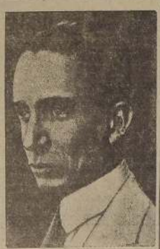
EL EMIR GHAZI, Rey de Irak, muerto a causa de un accidente automovilístico.

El Ghazi nació en la Meca el 21 de marzo de 1913. Su padre fue íntimo amigo del coronel Lawrence, de Arabia, con cuya ayuda fue hecho Emir de Irak.