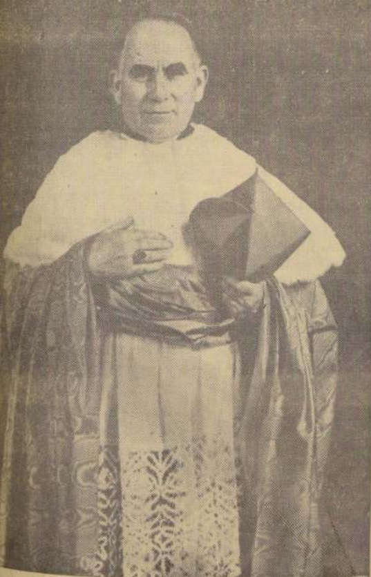
Monseñor Raúl Silva Henríquez, Arzobispo de Santiago y segundo Cardenal de Chile, quien llegará hoy de regreso de Roma, donde recibió la birreta cardinalicia.