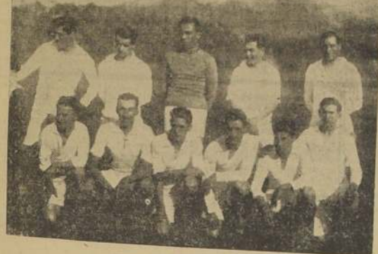
Cuadro de los italianos.

El inter-ligas se resolvió con la victoria de la Arrieta