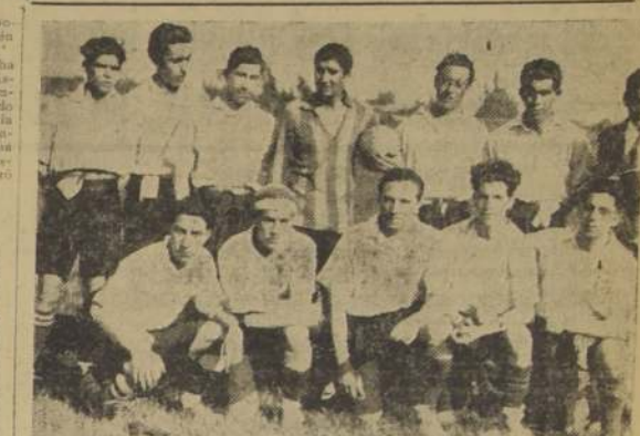
El Wellington que representó a la Liga Providencia.

Defensiva se presentaba esta vez con cambios de importancia en sus líneas y el partido de ayer tenía todos los caracteres de una prueba para formar el cuadro definitivo de los españoles. EL PRELIMINAR En el encuentro del Cuatro Nacional, con la U. D. Española III, correspondió el triunfo a estos últimos por tres tantos contra uno.