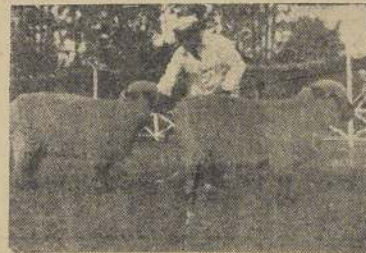
Ovejas "Paz" y "Concordia"