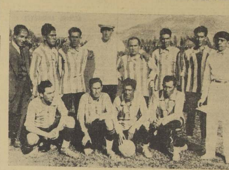
El conjunto de la victoria de Los Andes, cuyo guardavallas fué una verdadera revelación.

En Santa Laura se efectuó en la tarde de ayer, ante una numerosa concurrencia, el colpeo entre los primeros cuadros de la Unión Deportiva Española y del Victoria, de Los Andes. El cuadro visitante venía precedido de los prestigiosos adquiridos en una buena campaña en su ciudad y había interés por verlo frente a un cuadro como el de los españoles. Por otra parte, el once de la Unión Deportiva Española, que ayer se demostró