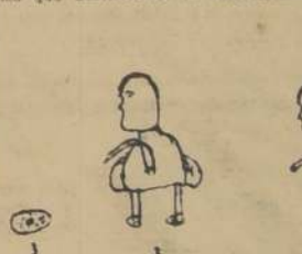
Narración gráfica por un niño de 11 años, con edad mental de 10. (1) madre; (2) hija; (3) plato; (4) jardín.