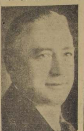
Señor Otakar Suchau, Cónsul de Checoslovaquia.

La nación checa conmemora hoy el 110 aniversario de su independencia política, efectuada al terminar la conflagración europea que disolvió el secular imperio austro-húngaro, permitiendo que los pueblos sojuzgados por la monarquía de los Habsburgos recobraran su auto-