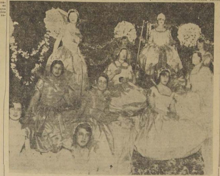
Su Majestad Teresa I y sus damas de honor.

Cerca de las tres de la madrugada el público comenzó a retirarse, recordando Macul su aspecto habitual.