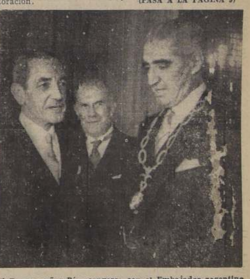
El Excmo. señor Ríos conversa con el Embajador argentino, Excmo. señor Carlos Guiraldes, después de recibir la condecoración.

2.º—Que en estos momentos el Ministerio de Hacienda estudia el financiamiento respectivo.