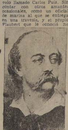
Gustav Flaubert, autor de "Madame Bovary"