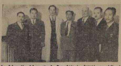
La delegación del puerto de San Antonio, durante su visita de ayer a LA NACION.