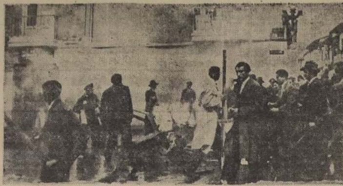
BOGOTÁ. — (Colombia). — Manifestantes prenden fogatas en las calles de Bogotá durante los disturbios de violencia ocurridos el 9 y 10 del presente en la capital colombiana. A pesar de estos hechos luctuosos, la Conferencia Panamericana reanuda sus labores, el 14.

La casa de Gaitán es una modesta construcción de ladrillos de dos pisos en el barrio de Santa Teresita. Gaitán la compró hace unos doce años. Por subscripción popular se erigió una estatua de Gaitán en el futuro parque que llevará su nombre.