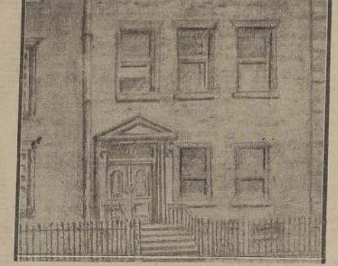
137 Waverly Place, la casa donde vivió Poe en Greenwich Village, el barrio de los poetas y artistas de Nueva York

bre o golpearon con fuerza en la puerta y esperaron. Nadie abrió. Recurrieron entonces a dar aviso a la policía, y ésta derribó la puerta del apartamento. Y allí hallaron a Mr. Romatka, tendido en el lecho, de viaje por la muerte. La atmósfera de aquella "academia" era impresionante: sobre el escritorio había numerosos manuscritos y cartas sin abrir. El "maestro" había te-