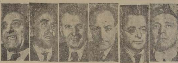
DI VITTORIO | Lenzo | Paolardi | Saragat | Togliatti | Scelba

El jurado del Tribunal Federal deliberó más de cuatro horas antes de anunciar el veredicto unánime contra Best.