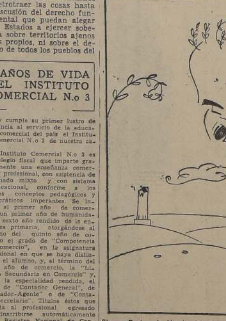
Signor Enrico de Nicola, Presidente de Italia, país que celebra hoy trascendentes elecciones legislativas.

Los proyectos de ley sobre los cuales deberá pronunciarse el Congreso Nacional, durante el período extraordinario de sesiones, acusan una marcada urgencia. Las iniciativas para legislar se refieren a asuntos que deben quedar resueltos con el máximo de rapidez posible, a fin de eliminar serios contratiempos y establecer normas de evidente interés para el país.