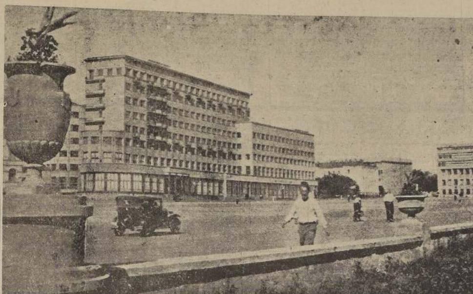
Vista de la plaza de Dzerzhinsky, en Kharkov, ciudad hacia la cual avanzan los rusos en una ofensiva destinada a anular la ofensiva de primavera lanzada por los alemanes, en la península de Kerch

Los furiosos ataques emprendidos por la Luftwaffe en los frentes de Murnau y Loush constituyen para algunos observadores una serie de maniobras preparatorias de la ofensiva prusiana en la zona de Kerch. Se hizo notar que el comando alemán realizó los ataques aéreos contra las tropas y los pertrechos enemigos. Siempre las acciones de ofensiva son precedidas por ataques de esta naturaleza. Otro posible teatro de la ofensiva es la zona de Volkov, al suroeste de Leningrado donde según los alemanes, fue aniquilado un grupo de fuerzas enemigas copadas por un regimiento o una división entera de fusileros. Una ofensiva allí podría tener como objetivo principal el enlace entre el corredor germano que lleva a Schlisselburg sobre la orilla meridional del