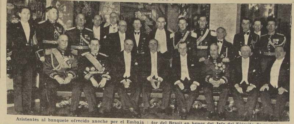
Asistentes al banquete ofrecido anoche por el Embajador del Brasil en honor del Jefe del Ejército de su país.

Después de conversar sobre tópicos de diverso carácter y de expresar el general brasileño el agrado con que cumplía su aspiración de visitar Chile, se puso término a la entrevista despidiendo al señor Goes Monteiro y comitiva en el Salón de Honor del Palacio de La Moneda.