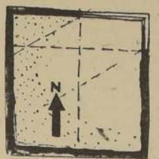
Ventana angular. Máximo de luminosidad.