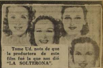
Tome Ud. nota de que la productora de este film fue la que nos dio "LA SOLTERONA".