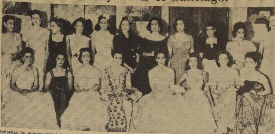
Señoritas de nuestra sociedad que participaron en la fiesta que se realizó ayer en el Teatro Santiago a beneficio de las obras sociales de la Parroquia de San Rafael