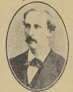
Señor Alejandro del Fierro, Ministro de Relaciones en 1879.

Hace cincuenta años, el entonces Ministro de Relaciones Exteriores, don Alejandro del Fierro, puso su firma al decreto que ordenó la ocupación de Antofagasta.