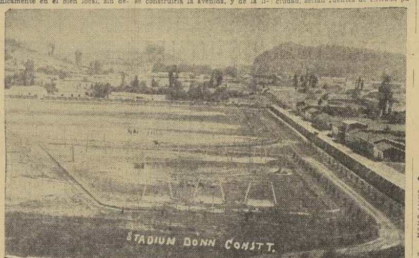
STADIUM BONN CONSTT.

Como usted lo puede apreciar, este balneario se transformará totalmente, a corto plazo, y es una satisfacción para nosotros poder ayudar con nuestro trabajo a la obra de reconstrucción y progreso que está realizando S. E. el Presidente de la República. — (Eduardo Vergara H.).