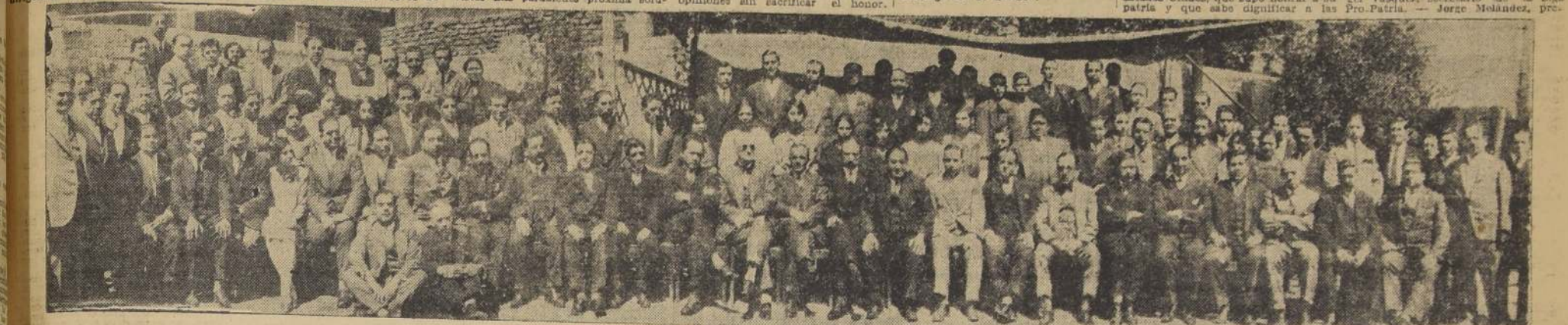
Asistentes al banquete con que la Sociedad Dávila Baeza conmemoraba su aniversario.