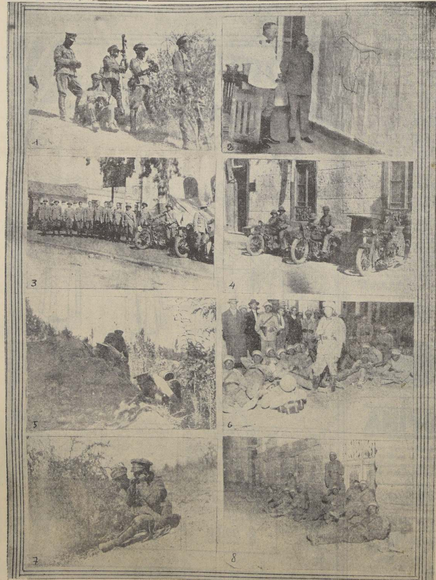
1. Oficiales en observación. — 2. El Inspector General del Ejército observa una carta del campo de maniobras. — 3. Oficiales del Estado Mayor Rojo. — 4. Servicio de comunicación. — 5. En una trinchera. — 6. Descansando. — 7. Dando informaciones por teléfono. — 8. Patrullas en las calles de Talca.

Este combate aéreo fué presenciado por el Inspector General del Ejército, General señor Francisco J. Díaz V. y los oficiales del Estado Mayor, quienes siguieron atentos el desarrollo de esta acción, comentando la pericia y el espíritu de sacrificio de nuestra aviación. (Osorio).