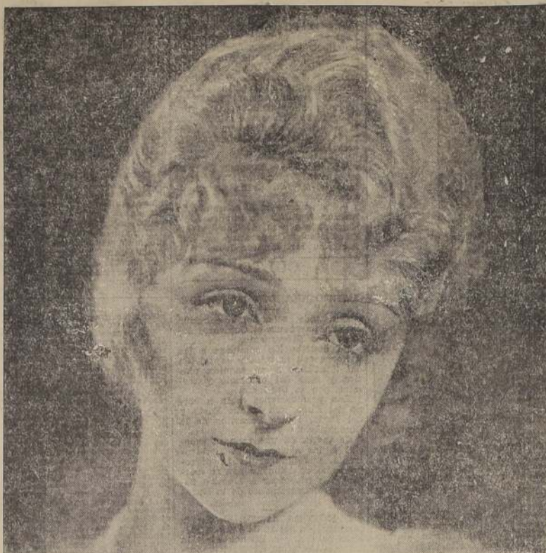
(PELICULA NO APROBADA PARA MENORES DE 15 AÑOS, NI RECOMENDABLE PARA SEÑORITAS)

Lujo maravilloso — Visiones deslumbrantes de "EL JARDIN DEL EDEN".