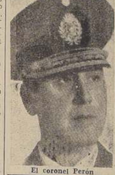
El coronel Perón