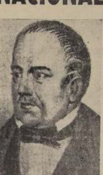
José Miguel Infante

La aparición del primer periódico en Chile, es una de las glorias del General don José Miguel Carrera, pues mediante su iniciativa personal se logró traer de Estados Unidos la imprenta en que el frate de la Buena Muerte, Camilo Henríquez, pudo editar la hoja patriótica que sembró las semillas de Patria y Libertad en el oscuro ambiente colonial.