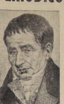
Manuel de Salas