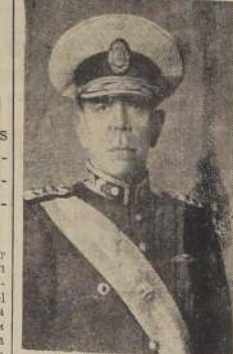
El Presidente Farrell