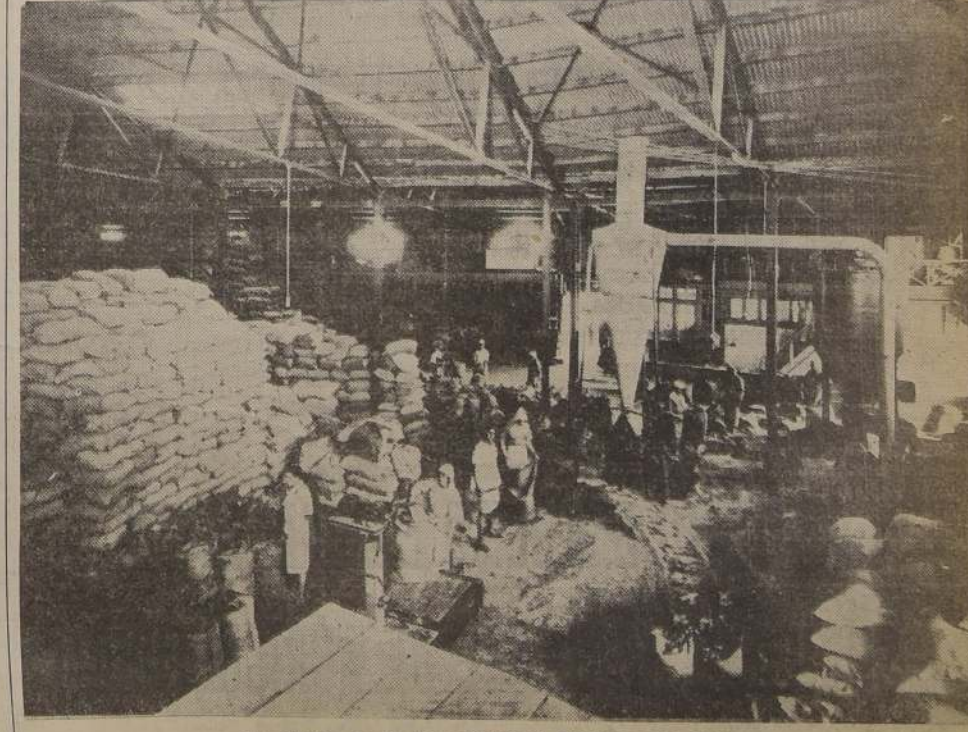
Un aspecto de la gran Fábrica de Alimentos para Aves.