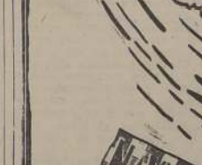
¡Que Feliz Afeitada!

Después de 5 días de silencio, los cañones alemanes establecidos al otro lado del Canal de la Mancha, abrieron fuego alrededor de las 9 P. M., disparando decenas de granadas durante 17 minutos.