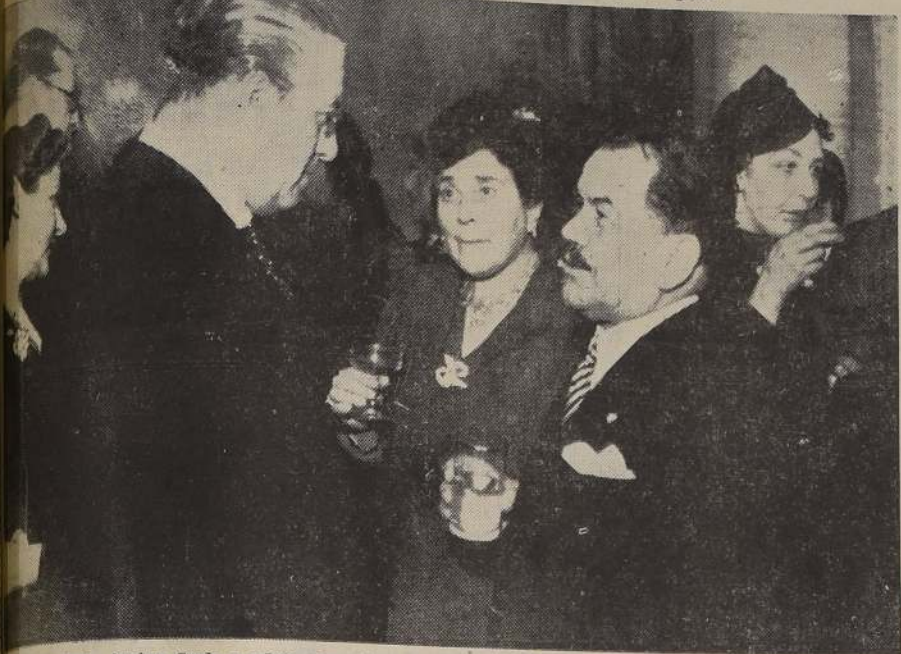
El Excmo. don Pedro Aguirre Cerda y señora acompañados del Embajador de México y señora de Reyes Spindola en la recepción de ayer.

Brillantes caracteres alcanzó la recepción que ofreció ayer el Excmo. señor Reyes Spindola con motivo del Día Nacional de su país