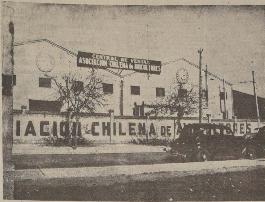
El nuevo local que tiene la Asociación Chilena de Avicultores en la Avenida Balmaceda 2290, en el cual mantiene todos sus servicios, como ser: la gran Fábrica de Alimentos para Aves, el Departamento de Clasificación y Envases de huevos, Cámaras Frigoríficas y Central de Ventas.

— ¿Es verdad que en Chile se consumían huevos extranjeros antes que existieran los grandes Criaderos? — Según los datos que obran en mi poder, la población de nuestro país consumía más de 8.000.000 de huevos al año del extranjero; pero en 1932 la industria nacional, no solamente estuvo en condiciones de abastecer el mercado interno, sino también de enviar una apreciable cantidad de huevos a Inglaterra y España, envío que se hizo por intermedio de la