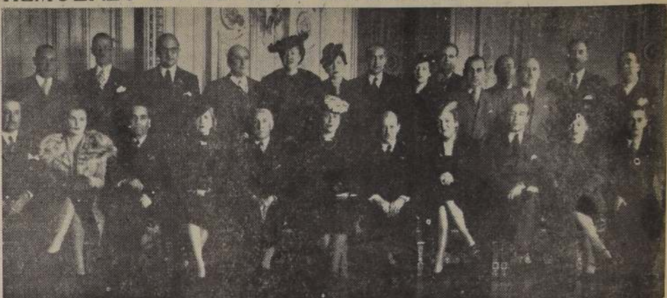
Almuerzo ofrecido en el Club de la Unión por un grupo de amigos a la Delegación peruana al Congreso de Municipalidades.