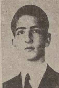
S. M. Pedro II de Yugoslavia.

EL CAIRO, 16. — (U. P.). — Ahora que aviones del Ejército bombardearon la ciudad está en los labios de todos la pregunta: ¿será bombardeada Roma? Aunque una pocas bombas habían sido arrojadas en el momento en los suburbios de El Cairo, es esta la primera vez desde el comienzo de la guerra que ha sido bombardeada la capital del Egipto. Según se cree tomaron parte numerosos aviones y fueron arrojados bombas explosivas y bombas luminosas.