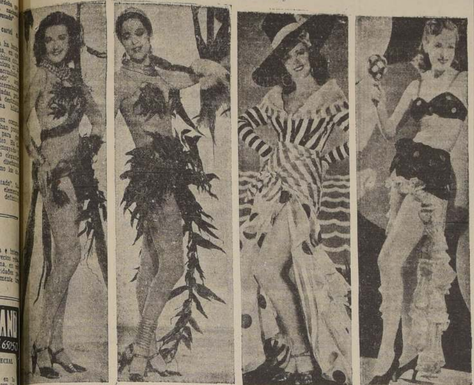
Los modelos de Estados Unidos aparecen en las escenas musicales de la gran producción Metro Goldwyn Mayer "Las Follies de Ziegfeld", que estrena en sus funciones de hoy el Teatro Metro. — Esta película, con su maravillosa rumba "Minie en Trinidad", que canta Judy Garland, ha sido la inspiradora de nuestro concurso de bailes modernos, que finalizará esta noche en el "Lucerna" a las 12.30 P. M.

competencia final, entre las parejas ganadoras de las ruedas anteriores, ha despertado un gran entusiasmo entre nuestro público. — Proclamados los campeones se procederá a la entrega de los premios que han donado importantes casas comerciales de nuestra capital. — Dos joyas fantásticas, otorgadas respectivamente por la "Joyería París", Ahumada 211 y "Casa Laarsen", otorgando 386, aumentan desde hoy el número de valiosos premios. — Hoy estrenará el Teatro Metro, en sus tres funciones la producción musical "Las Follies de Ziegfeld", grandiosa película que ha inspirado la realización de este gran concurso. — James Stewart, Judy Garland, Hedy Lamarr, Lana Turner y Toni Martin, son las principales figuras de esta maravillosa producción Metro Goldwyn Mayer.