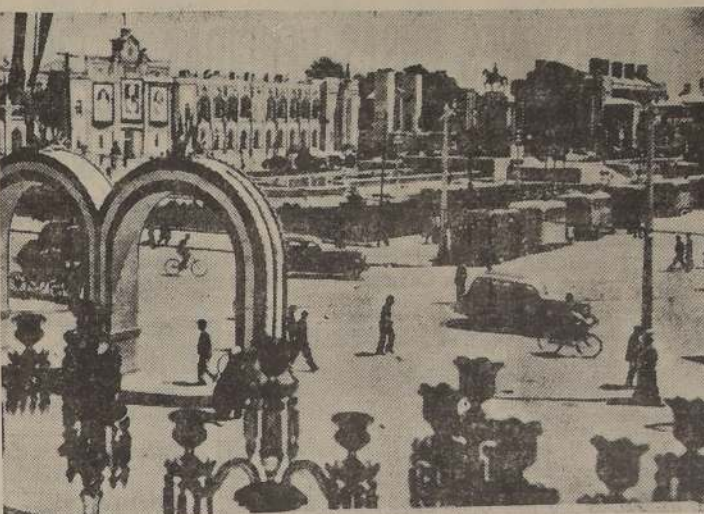
La ciudad de Teherán, objetivo de las fuerzas anglo-rusas.

TEHERAN, 16. — (U. P.). — Oficialmente se anunció esta mañana que el ex-Sha de Persia, Riza Pahlevi, abdicó el trono a favor de su hijo el príncipe heredero Mohamed Pahlevi, de 31 años de edad.