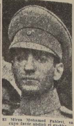
El Mirza Mohamed Pahlevi, ex-Sha de Persia, cuyo favor abdicó el ex-Sha.

Canberra, 16 (U. P.). — El Gobierno australiano ha anunciado el préstamo emitido a la fecha, por 100 millones de dólares, para la conversión del empréstito de 15 de noviembre de 1940, en un empréstito de 15 de noviembre de 1941, por el cual se pagan los intereses al 5 por ciento y el principal en 15 años.