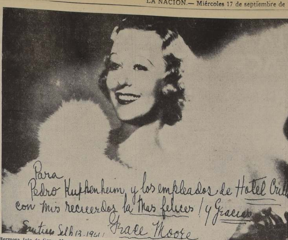
Hermosa foto de Grace Moore con su dedicatoria a la dirección del Hotel Crillon, donde se hospedó durante su estadía entre nosotros.

ZIEGLER.— En la tarde de hoy será... en la Sala del... de Chile la exposición... cuadros del pintor acua-... de Alfredo Ziegler, que... una colección de... de paisajes del sur... y miniaturas en re-... que han llamado ju-... la atención por su... pública que la ha visita-... y se ha considerado... de los mejores éxitos ar-... de la temporada.