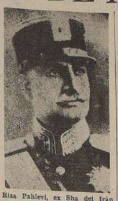
Riza Pahlevi, ex-Sha de Persia.

El ex Sha abandonó el poder en favor de su hijo, el Príncipe heredero, Mohamed Pahlevi.