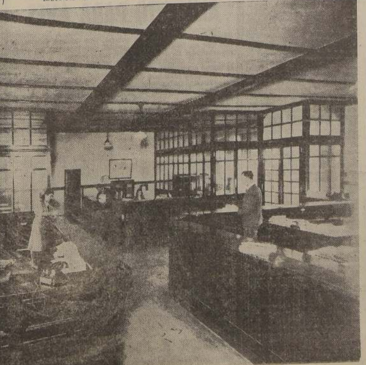
Una de las oficinas generales del edificio modelo que ocupa la Asociación en la Avenida Balmaceda 2290