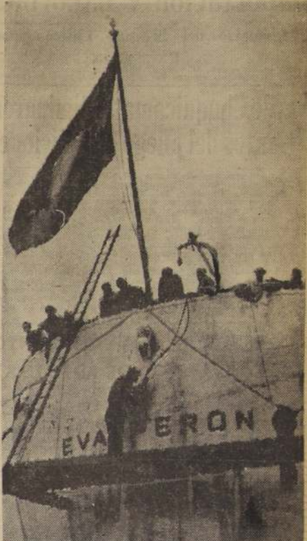
LONDRES.— Un obrero con una lámpara de acetileno se dispone a hacer desaparecer las letras del nombre "Eva Perón" de la popa del barco mercante argentino, el que se encuentra en un dique seco de este puerto. El nombre de "Uruguay", reemplazará al de la finada esposa del ex mandatario. Con esto se observa la política del Gobierno provisional argentino de borrar todo vestigio de nombres que recuerden al régimen dictatorial recientemente eliminado.

COMPRO - VENDO - PERMUTO FUNDAS NYLON PARA CUALQUIER AUTOMOVIL. RE ENTREGAN EN EL DIA - SE HACEN TRABAJOS DE DESABOLLADURA Y PINTURA KOHON V. SANTIAGO VICTORIA 328 AL 332 (Entre Portugal y Lira) FONO 36931