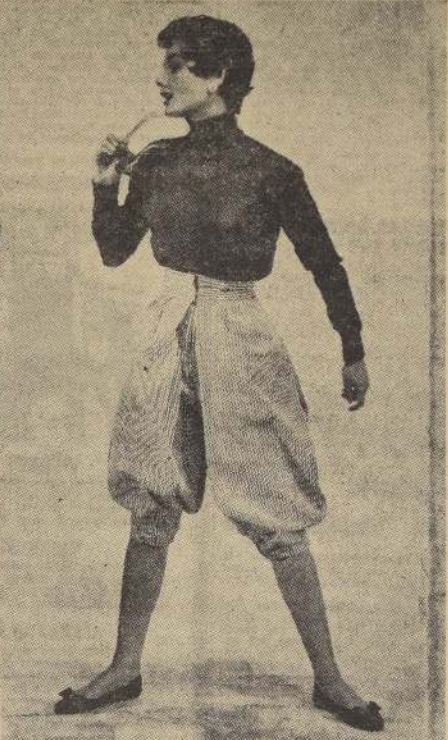
APARECE PARA EL VERANO con un pantaloncito a rayas tal como el de este diseño de "Boutique Lanvin-Castillo". Es el estilo pirata que los modistos franceses llamaron "Fet" y que está destinado a dejar con "un palmo de narices" a los que miren a las jóvenes que los usan. Una blusa subida, con ligeros pliegues en el cuello y en las mangas, es el complemento de esta juvenil tenida de verano. Ahora que ya se acerca el tiempo de los week-end en la playa, comenzarán a ser útiles estas frescas y femeninas prendas.