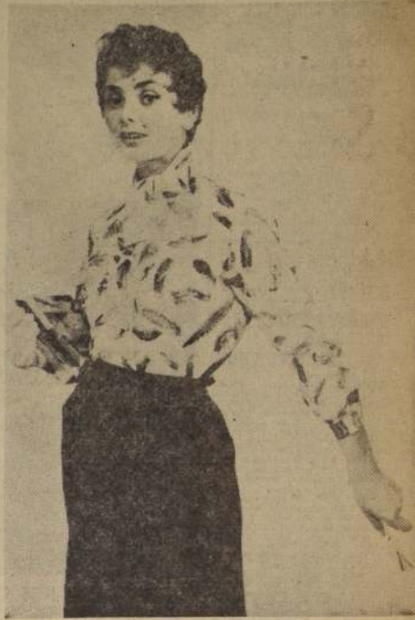
"PLUMAS", denominó la casa Hermes a esta blusa de seda estampada, con motivos, justamente, de gran variedad de plumas. Es un modelo especial para estudiantes y para mujeres que trabajan, y se lleva con una falda oscura con ligeros pliegues en el tallo.