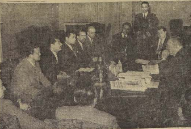
Durante la entrevista que S. E. el Presidente de la República concedió ayer a los dirigentes de la Asociación de Empleados y Obreros de la Empresa de Transporte Colectivo del Estado, y en la cual los mencionados dirigentes le hicieron entrega al jefe del Estado de un memorándum que contiene los diferentes problemas que afectan al gremio que dirigen y que damos en información aparte.