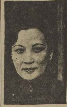
La señora Chiang-Kai-shek

Sin embargo, los países occidentales se han manifestado escépticos acerca de la posibilidad de un acuerdo con Rusia sobre el problema monetario de Ber-