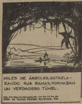
MILES DE ÁRBOLES, ENTRELAZANDO SUS RAMAS, FORMABAN UN VERDADERO TÚNEL.