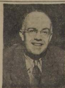
Oscar Lange, delegado de Polonia ante las Naciones Unidas

DEFENSA DEL PLAN MARSHALL El delegado de Estados Unidos, Willard Thorp, defendió el Plan Marshall, así como el sistema de permisos de exportación que tiene Estados Unidos, el cual, dijo, está destinado a impedir y restringir la exportación de artículos "para uso directo o indirecto con fines militares en el extranjero". Thorp dijo que "ha sido reiteradamente expresada" la preocupación de los países libres de todas partes del mundo, por las palabras, la política y los actos agresivos de la Unión Soviética y otras naciones de la Europa Oriental, que están bajo la do-