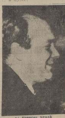
El Primer Spaak

BRUSELAS, 26. (UP). — Se ha formado un nuevo Gobierno belga, presidido por Paul Henri Spaak, que desempeñaba las carteras del Interior y de Relaciones Exteriores en el Gabinete que cayó hace una semana. Se requirió una semana para que Spaak pudiera formar un nuevo Gobierno de coalición entre socialistas y social-cristianos. No tuvieron éxito las tentativas del dirigente católico Gastón Eykens para formar un Gabinete, por lo que el príncipe regente Carlos confirió el encargo nuevamente a Spaak.