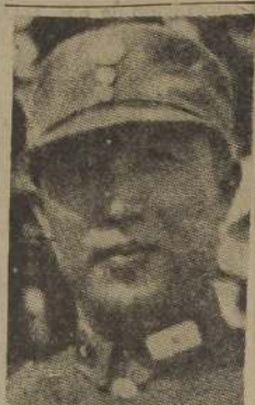
El general nacionalista Li Mi, quien ha obtenido algunos triunfos contra los rebeldes en el Norte de China

Estados Unidos guarneció el puerto de Tsing-Tao; Sra. Chang-Kai-Shek irá a pedir ayuda a EE. UU.