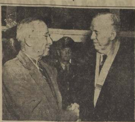
MARSHALL ES SALUDADO POR TRUMAN A SU REGRESO DE PARÍS.

WASHINGTON, 26. (U. P.). — La Administración de Cooperación Económica, otorgó asignaciones por valor de 27 millones 992 mil 162 dólares. De esta suma correspondió a Gran Bretaña 2.490.000 dólares, a Bélgica y Luxemburgo 5.295.985, a Dinamarca 21.000, a Grecia 5.518.777, a Irlanda 212.000, a Italia 6.417.000, a Holanda 700 mil, a Indonesia 3.600.000, y a Trieste 1.003.000. La Administración también