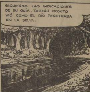
SIGUIENDO LAS INDICACIONES DE SU GUÍA, TARZAN PRONTO VIÓ COMO EL RÍO PENETRABA EN LA SELVA.