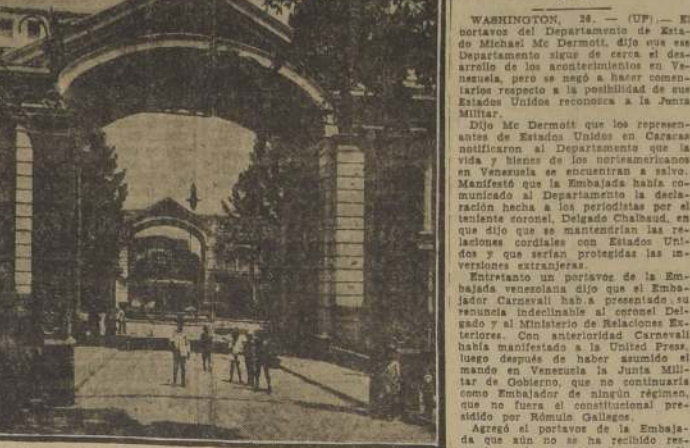
Entrada del Palacio de Miraflores, sede del Gobierno de Venezuela.

A salvo los bienes de los norteamericanos en Venezuela. — Renunció el Embajador en Washington