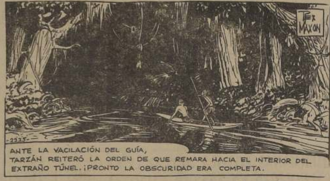
ANTE LA VACILACIÓN DEL GUÍA, TARZAN REITERÓ LA ORDEN DE QUE REMARA HACIA EL INTERIOR DEL EXTRAÑO TÚNEL. ¡PRONTO LA OSCURIDAD ERA COMPLETA.