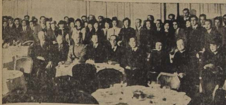
Parte de los asistentes a la manifestación ofrecida por el Instituto Chileno-Boliviano a los estudiantes del Atipilano, que actualmente se encuentran en Santiago

Actos en homenaje a Simón Bolívar y Bernardo O'Higgins. — Sesión solemne del Instituto Chileno-Boliviano en la Universidad de Chile