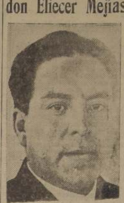
Don Eliecer Mejías, presidente del Partido Radical

UNA COMISION ESTUDIARA EL MEJORAMIENTO DE LA SITUACION DEL PROFESORADO.— OYO UNA EXPOSICION SOBRE LA LINEA DEL F.C. DE CIRCUNVALACION