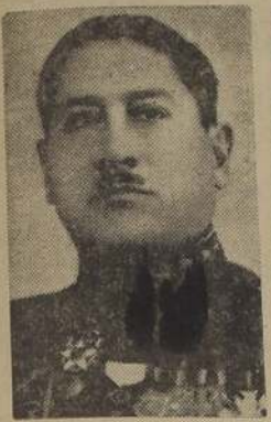
Excmo. señor Enrique Páez, Presidente de Bolivia, país que celebra hoy el aniversario de su independencia nacional.