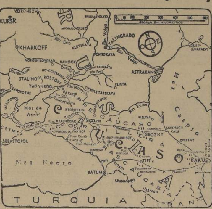
Escenario de la lucha en el Cáucaso y en la Cuenca del río Don