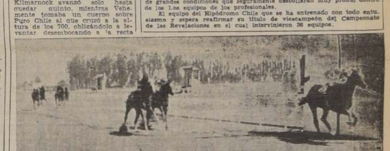
Nebucano se impone sobre El Pampa, Falso Niño y Rosignol en la condicional reservada a productos ganadores