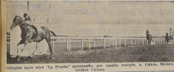
Wellington hace suya "La Prueba" derrotando por amplio margen a Figaro, Malayo y Golden Chimes