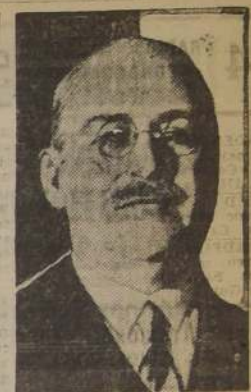
Excmo. Sr. AGUSTIN P. JUSTO

"En la costa de Lekeitio nuestras baterías costeras hicieron 22 remociones rebeldes armados."