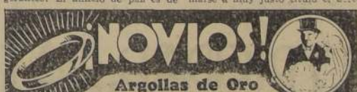
Argollas de Oro

Garantidas, macizas, selladas y grabadas, desde $ 98 el par.