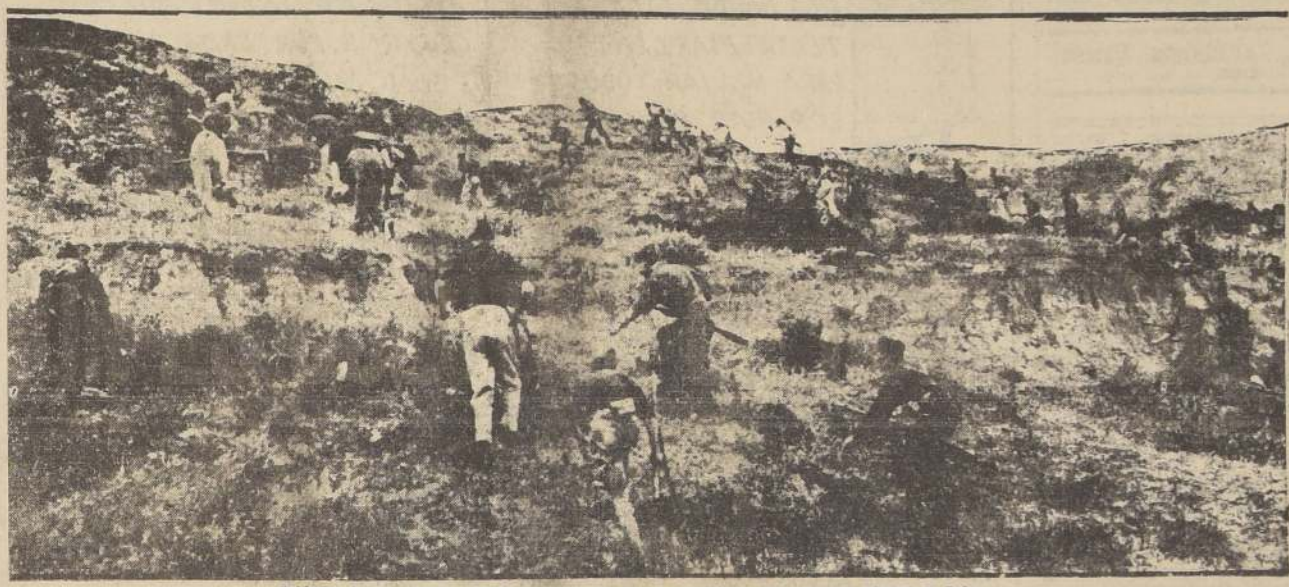
Soldados de las fuerzas rebeldes escalan una de las montañas que rodean la ciudad de Irun

Los leales insisten en que, durante el bombardeo de ayer en