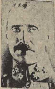
S. M. Christian X

Desde el cultural y el Rey ha dado lugar a un homenaje a su persona y a su obra, en el 72.º aniversario del nacimiento del monarca. Este día, el pueblo danés celebra el natalicio de su Rey, un día que se ha convertido en una gran fiesta popular. Desde aquel día, el pueblo danés celebra el natalicio de su Rey, un día que se ha convertido en una gran fiesta popular.