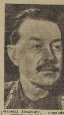
General Alexander, comandante ejecutivo de las operaciones terrestres