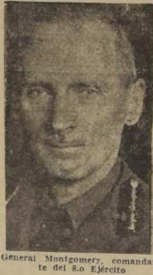
General Montgomery, comandante del 8.º Ejército