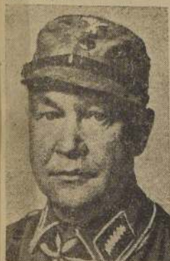
General von Arnim, jefe de las tropas del Eje en Túnez, quien cayó prisionero de los aliados.

ARGEL, 12.— (U. P.) Un comunicado especial expedido en las últimas horas de esta tarde por el Cuartel General de Eisenhower anunció dramáticamente que toda la resistencia del Eje en Africa ha cesado, poniéndose así término al dominio nazi-fascista en Africa, y cerrándose un capítulo vital en la guerra de las Naciones Unidas contra la máquina bélica de Adolfo Hitler.