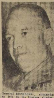
General Eisenhower, comandante en jefe de las fuerzas aliadas en Africa