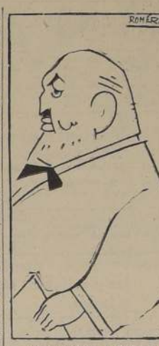
Angel Ossorio y Gallardo.

Los españoles no alcanzan a conocer una democracia orgánica. La propia república cometió errores y sacó de