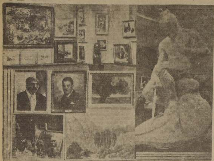
Parte de las obras que figuran en el Salón inaugurado hoy