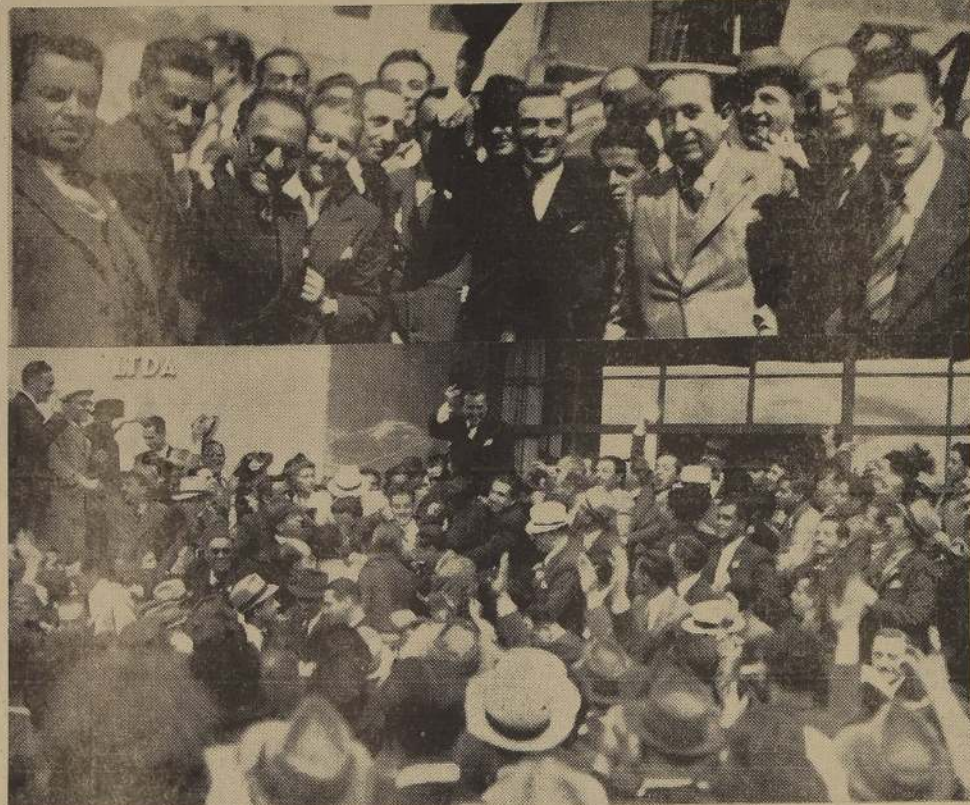
El señor González Videla saluda a sus numerosos correligionarios que fueron a esperarlo al aeropuerto de Los Cerrillos. — Abajo: partidarios entusiastas del precandidato radical, lo conducen en andas hasta el automóvil

En esta reunión, que se prolongó casi por una hora, el señor González se informó de su campaña y agradeció a los dirigentes haberse fijado en su