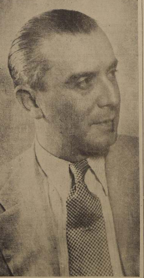
Don Gabriel González Videla

Una formidable salva de aplausos que duró varios minutos saludó el nombre de Gabriel González cuando éste ocupó la tribuna. El candidato de la Izquierda di-