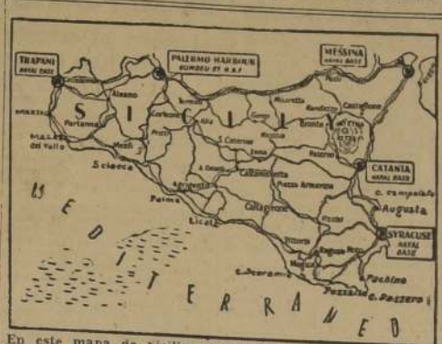
En este mapa de Sicilia, puede verse directamente sobre la ciudad de Catania, el Monte Etna, que en su reciente erupción, hace peligrar pueblos y aldeas.

El torrente de lava fue acompañado por un cráter secundario que abrió erupción el domingo en la noche. La lava de este cráter corre por un terreno montañoso y a través del bosque de Castiglione, que está en peligro.