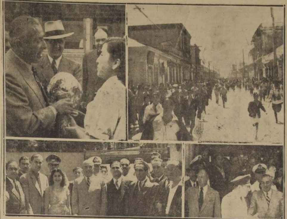
El Presidente de la República en el transcurso de su jira, recibe los homenajes de auténticos representantes del pueblo. Miles de ciudadanos siguen de cerca los coches que conducen a S. E. y comitiva. Autoridades civiles y militares rodean al Primer Mandatario en su visita a La Serena y Ovalle.