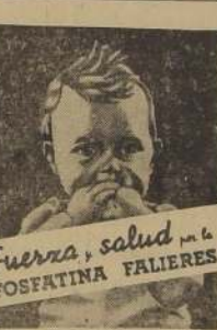
Fuerza, salud y FOSFATINA FALIERES