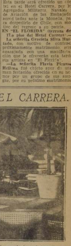
Aspecto tomado en la Piscina del 17.º Piso del Hotel "Carrera", sitio que, juntamente con su anexo "El Florida", son los preferidos por la juventud de la capital.