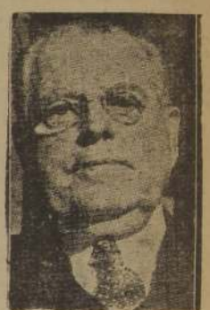
Warner R. Austin

LA SEGURIDAD DE ESTADOS UNIDOS Austin defendió con vigor el proyecto de acuerdo de fideicomiso de Estados Unidos, diciendo que es "absolutamente vital" para su seguridad y para la seguridad internacional, que Estados Unidos sea facultado para cerrar todas o cualquiera parte de esas islas, como "zonas estratégicas".