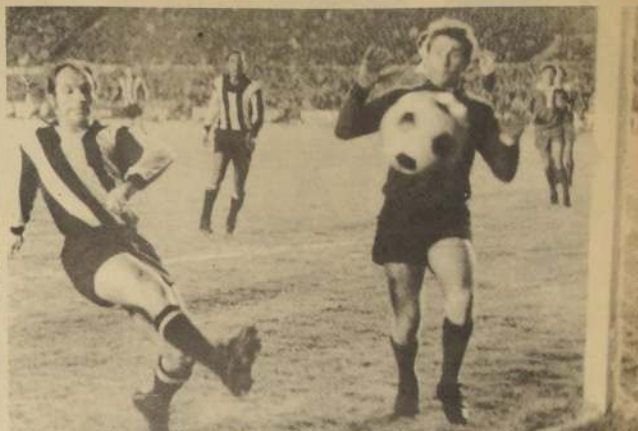
MONTEVIDEO. En los primeros 10 minutos de juego parecía una Caldera del Diablo el Estadio Centenario. Cincuenta mil uruguayos gritando, como si cada segundo significara una sentencia. Y era una sentencia. Cada balón era disputado con sangre y fuego. Tuvimos la sensación que nos mataban a todos. Ustedes tienen que haber visto en la televisión cada foul de los jugadores de Peñarol que daba miedo. Fútbol de intimidación, de terror, que con el correr de los minutos se fue aplacando. Se fue disminuyendo hasta entrar en el cauce normal. Si normal puede calificarse una semifinal de una Copa Libertadores de América.

POR ALFREDO LEONEL PARRA (Enviado Especial a Montevideo)