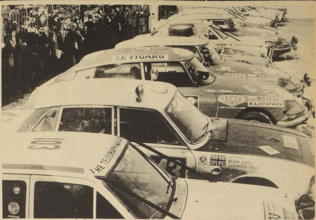
EN PARQUE CERRADO, ubicado en Huérfanos con Bandera, quedaron durante todo el día de ayer los 43 coches que continúan en el Rally Copa Mundial 1970. Salieron desde Inglaterra 106 máquinas. ¿Cuántas llegarán a México?

Las inscripciones están abiertas en la sede de Vizcachas, Bandera 172, R. piso. of. 14 y en ANAVE, Echaurren 75, desde esta fecha hasta el lunes 18 a las 20 horas.