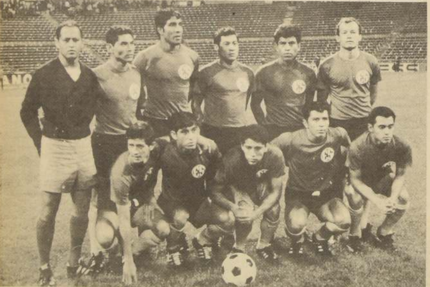
LA SELECCION salvadoreña ha tenido problemas de alimentación, pero de todas maneras piensa hacer pasar susto a sus rivales.