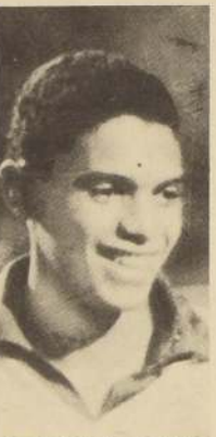
EL RELOJ de Jairzinho provocó dudas sobre la honradez de los periodistas cariocás.