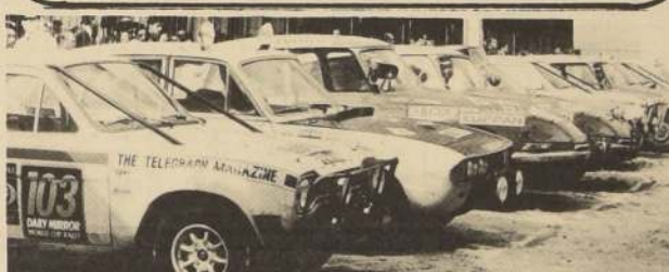
EN PRIMER PLANO, el coche N° 103 un adjudiándose un premio de quinientas libras para la etapa: Buenos Aires-Santiago. El coche luce perfectamente