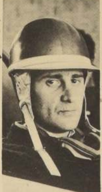
LO MEJOR DE ARGENTINA

En la misma fecha comienza el Torneo Promocional