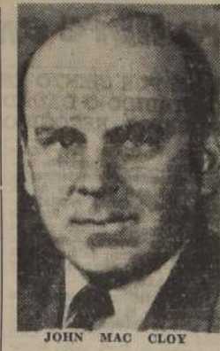
JOHN MAC CLOY

Mac Cloy dijo que ahora las fuerzas aliadas no están en Alemania como ocupantes, sino como defensores, y que el objetivo de las potencias occidentales es el de “ayudar a Alemania a constituir una unidad democrática bajo un Gobierno libremente elegido. Los comunistas se oponen a esta unión. Nosotros hacemos cuanto es posible por promoverla”.