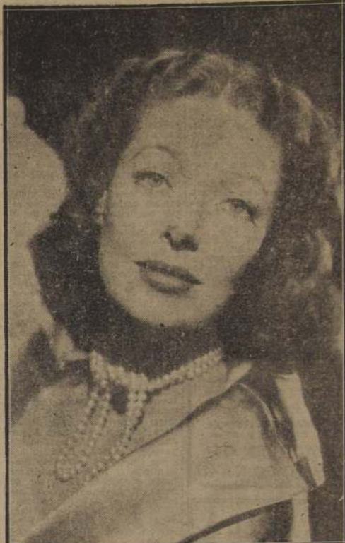
LORETTA YOUNG, acoge con beneplácito la crítica bien intencionada. Los artículos de alabanzas los echa al canasto.