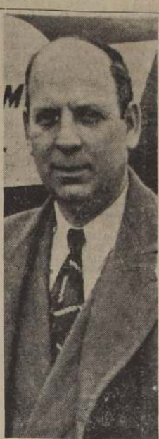
Alto jefe cinematográfico llegó ayer. — Via el Interamericano de la Panagra ha llegado procedente de los Estados Unidos, el señor Emanuel Silverstone, vicepresidente de la Twentieth Century Fox. El señor Silverstone es una de las personas más prestigiosas en el ambiente cinematográfico de los Estados Unidos, obediendo su visita a un interés personal en llegar a un arreglo con las autoridades respectivas, en nuestro país.

Con una asamblea en la Bolsa de Comercio y un banquete en el Hotel Carrera celebrará la Sociedad Nacional de Contadores el sábado, el 12.º aniversario de su fundación.