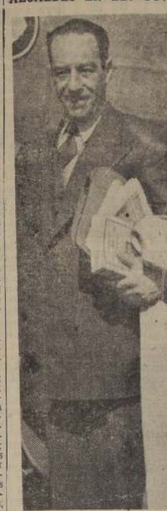
Regidor chileno presidió la Primera Sesión Plenaria del Tercer Congreso Panamericano de Alcaldes, que se celebró recientemente en Nueva Orleans y que inauguró el Presidente de la República, Excmo. señor González Videla, durante su visita a Estados Unidos.

UN REGIDOR CHILENO PRESIDIO SESION DE ALCALDES EN EE. UU.