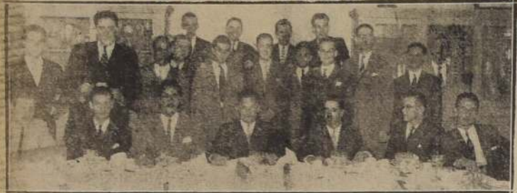
Comida de los ex alumnos de los Padres Franceses