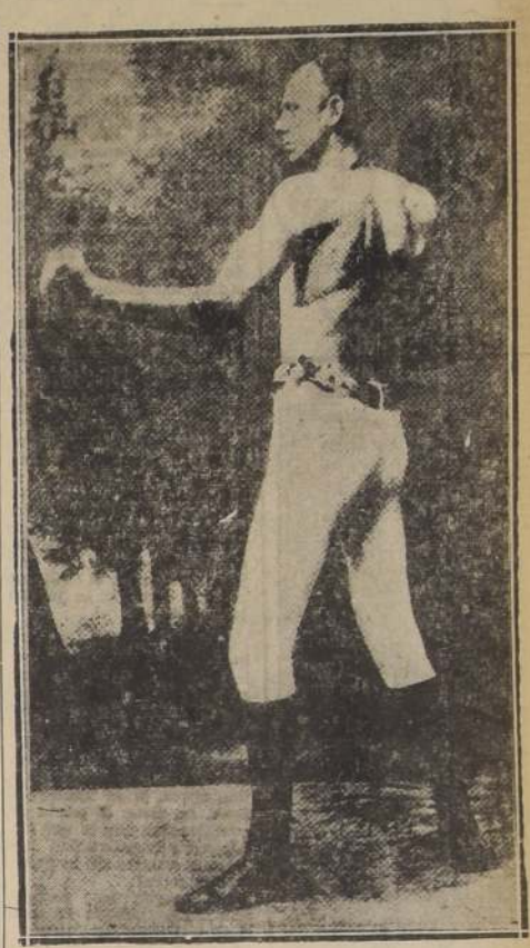
Bob Fitzsimmons, el formidable pugil inglés, que allá por los años de 1880, combatió con cinco hombres, la misma noche y en un mismo ring.

Concedido el encuentro, éste se celebró el 16 de enero de 1891 en la ciudad de Nueva Orleans, ganando Bob Fitzsimmons por K. O. en tres rondas, con "Ladino de esta manera, el título mundial de los pesos mediano, en el mismo ring, el 29 de mayo de 1880.