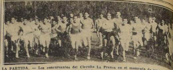
LA PARTIDA. — Los concursantes del Circuito La Prensa en el momento de iniciar el primer tiempo.

LOCAL: Casino del Estadio de Colo Colo. NOTA: Sólo tendrán acceso al local de la asamblea los socios de Colo Colo al día en sus cuotas de Diciembre en curso. Desde las 18 horas se atenderá en la puerta de entrada principal del Estadio el pago de cuotas. Antes de esa hora y durante todos estos días, en la Gerencia del club, San Pablo 1265, fono 80806.