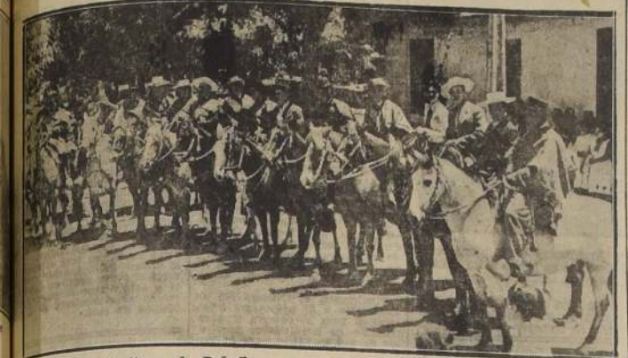
Pequeños agricultores de Peñaflores, que ayer hicieron lucida presentación campera

ASISTIERON AUTORIDADES, FUNCIONARIOS DE LOS SERVICIOS AGRICOLAS Y NUMEROSOS INVITADOS.