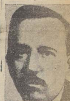
El padre de Violetta, a quien la joven, en su "diario íntimo", hace una acusación monstruosa