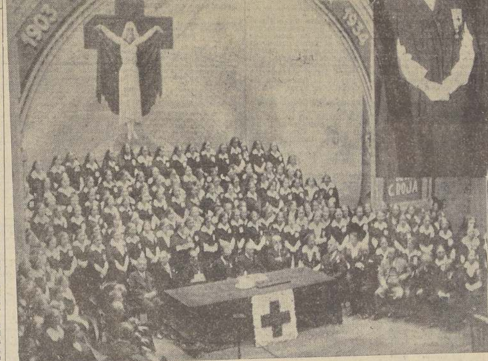
El palco escénico, durante la sesión inaugural de la Primera Asamblea de la Cruz Roja

ADVERTENCIA A LOS DELEGADOS Se nos encarga advertir a los delegados que deben encontrarse hoy, a las 10, en el local de la Academia de Guerra, Delicias 2577.