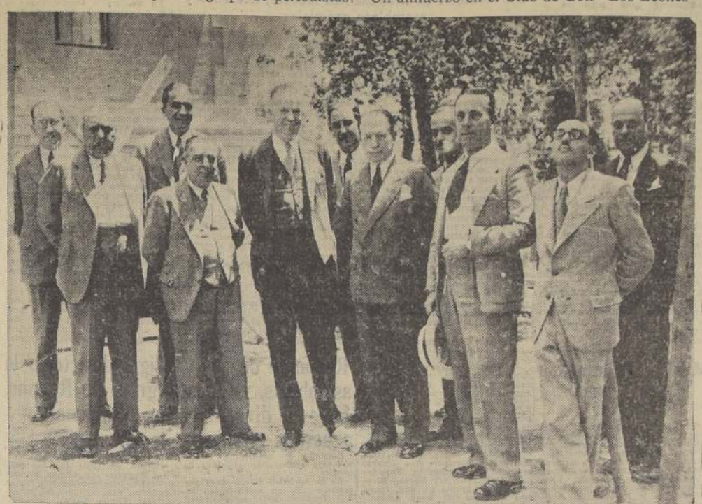
Asistentes al almuerzo ofrecido por la Cia. de Teléfonos

Servirá los sectores de Providencia y Los Leones. — Características de la nueva instalación. — Ayer fué visitada por un grupo de periodistas. — Un almuerzo en el Club de Golf "Los Leones"