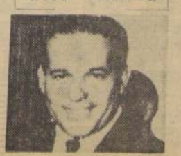
JOAO GOULART, Presidente de Brasil, quien viene a Chile en abril.