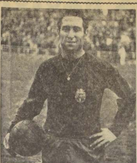
EL EXTRAORDINARIO puntero izquierdo de Real Madrid, Francisco Gento, alega que en la selección mundial debió incluirse a otros cracks españoles.

MADRID, 7 (UPI). — Bajo el signo de la selección mundial de fútbol, el crack internacional español comenta su designación en selección mundial que enfrentará a Inglaterra. México aspira a la sede de la Copa Rimet 1970. Ecuador ratificó su intervención en el S. A. de La Paz