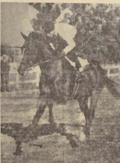
CON ESPUELAS trabajaron a Monarca en la arena palmeña. El pupilo de Raúl Allen se ve en buen estado y en su stud hay esperanzas que haga una muy buena presentación.

Una encuesta de LA NACION entre los profesionales del Hipódromo Chile