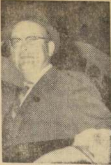
DELBERT PALMER , presidente de la Conferencia Episcopal de Chile, viajó a Nueva York, donde se reunirá con los altos representantes de esa religión.

Fomento Pesquero La Comisión de Pesca tiene listo su plan de racionalización de la distribución para poner en práctica en cuanto funcione el Terminal, junto con planes especiales para Valparaíso, Talcahuano y otros puntos del país. Aparte de ello la Comisión desarrolla una campaña de propaganda y divulgación educativa hacia el consumo de pescado, la cual no ha podido alcanzar mayor intensidad debido a la escasez de fondos para tales efectos.