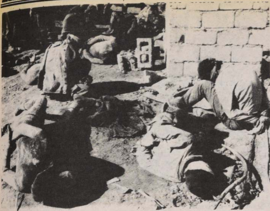
PRISIONEROS IRANIES. — En esta foto proporcionada por la agencia de noticias de Irak, prisioneros iraníes aparecen maniatados y con los ojos vendados después de haber sido capturados durante la ofensiva iraní en el sur de la zona de guerra. (Radiofoto Reuter).