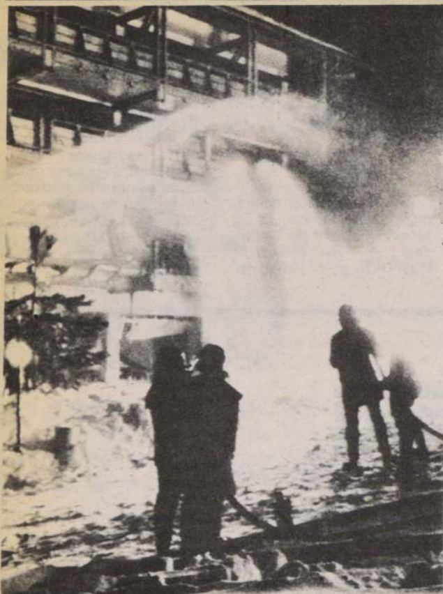
Bomberos alemanes intentan sofocar el incendio declarado en el Hotel Riessersee, en un concurrido y prestigioso centro invernal alpino.