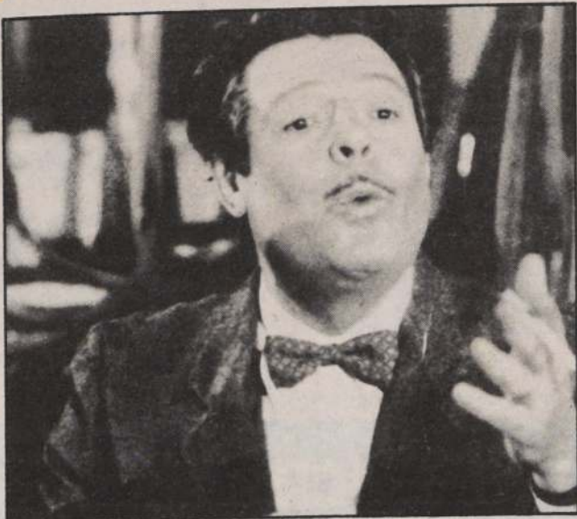
"Macaroni", un duelo de grandes astros del cine. Oda a la amistad sus efectos y su condición de indestructible.

en el año una programación de este tipo: Casa Constitución, Centro Cultural Mapocho, Espaciocal, Cine Arte con buena disponibilidad de excelentes filmes históricos y actuales como "El coronel Red" (en exhibición, ahora) y en especial el Cine Normandie, cuya línea se desarrolla con buen apoyo de público, ciclos de diversos directores, corrientes y escuelas.