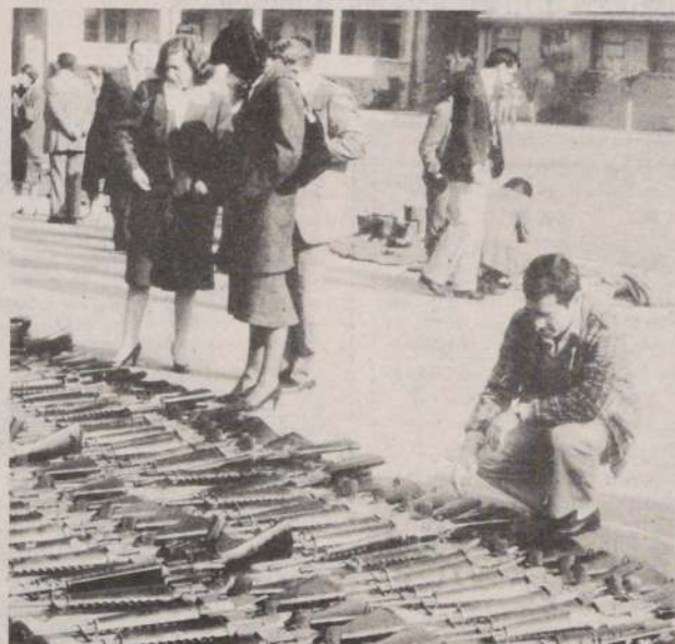
Esta es una pequeña parte del armamento con el cual los subversivos del Frente Manuel Rodríguez pretendían desatar la violencia en el país.

Esta es la realidad que sacudió al país antes del atentado contra el Presidente de la República, y que volverá a tomar vigencia en los primeros días del año que se inicia.