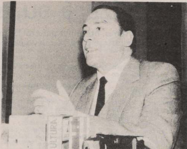
CRECE LA CONSTRUCCION. — El subsecretario de Economía, coronel Jorge Valenzuela, destacó el repunte de un 3,1 por ciento que experimentó la edificación del país entre enero y octubre último.

De convertirse en un hecho habitual, el país podría generar nuevas divisas por este concepto, lo que permitirá incentivar este tipo de actividad, y crear nuevos empleos en el sector.