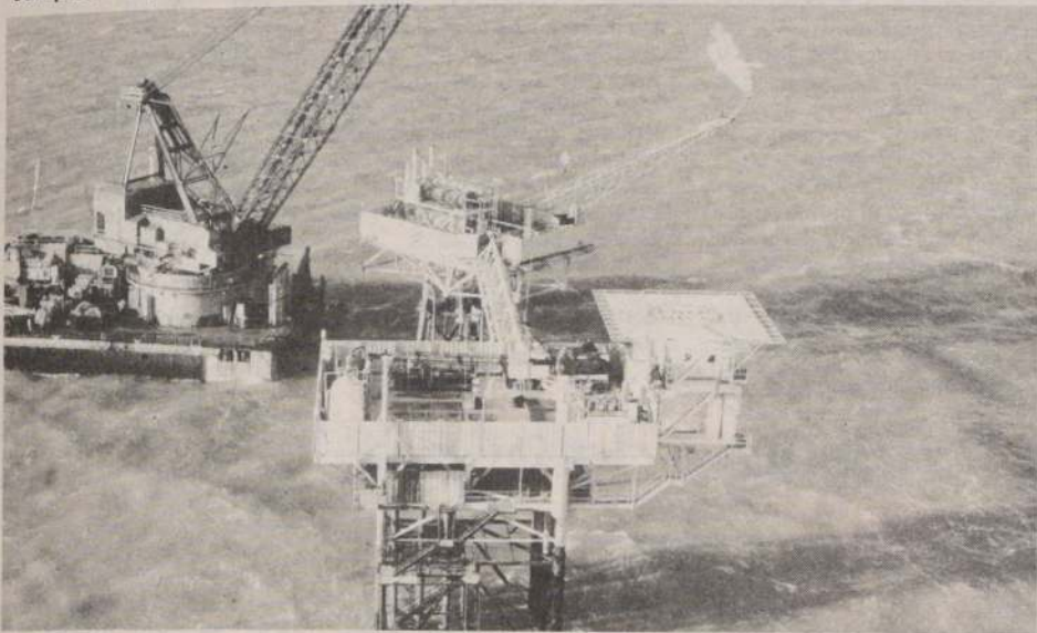
Hace 41 años, un 29 de diciembre, se descubrió en territorio chileno la existencia de petróleo, el "oro negro" de los últimos veinte años.

Ejecutivos de ENAP destacaron que las primeras conclusiones permiten abrigar un moderado optimismo acerca de las posibilidades de encontrar petróleo en esas extensas zonas.