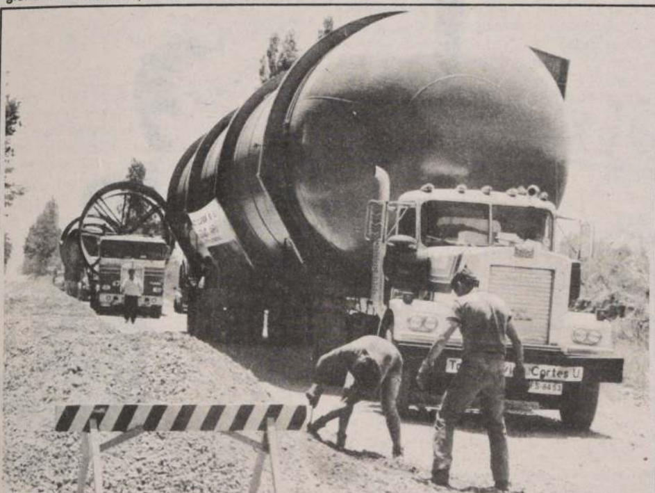
ESTANQUE PARA CODELCO. — Un estanque de almacenamiento de oxígeno de gran volumen para la División El Teniente, de CODELCO-Chile, construyó en su maestranza Maipú, la empresa Vapor Industrial S.A. siendo sus características principales, un peso de 52,59 toneladas, un largo de 25 metros, un diámetro de 4,60 metros y una capacidad de 300 metros cúbicos. Es uno de los más grandes fabricados en Chile y esto ha sido posible debido a que la adquisición de la ex Maestranza Maipú, ha permitido a Vapor Industrial S.A. ampliar su campo de acción a la fabricación de estructuras metálicas, calderería pesada en general y fabricación de maquinarias, abasteciendo a importantes empresas. En la foto, el gigantesco estanque parte hacia Rancagua para ser entregado a CODELCO-Chile.

"Esta expansión para todos los usuarios del sistema MAI-2000 les permitirá extender su sistema con un simple cambio en terreno" dijo William B. Patton Jr., presidente y ejecutivo principal de Mai Basic Four Inc. "El nuevo sistema puede doblar el número de usuarios soportados simultáneamente, darles un 50% de aumento en la capacidad de disco, cuadruplicar la memoria disponible y darles una potencia que es tres veces la que tiene en la actualidad, sin tener que realizar cambios sustanciales en su Software de aplicación. Como puede verse el nuevo MAI-3000 es la respuesta a las necesidades de empresas que tienen requerimientos de hasta 34 puertas para terminales. Sobrepasa nuestro compromiso hacia nuestros actuales clientes Mai Basic Four, entregándoles la solución ideal para llenar sus necesidades crecientes.