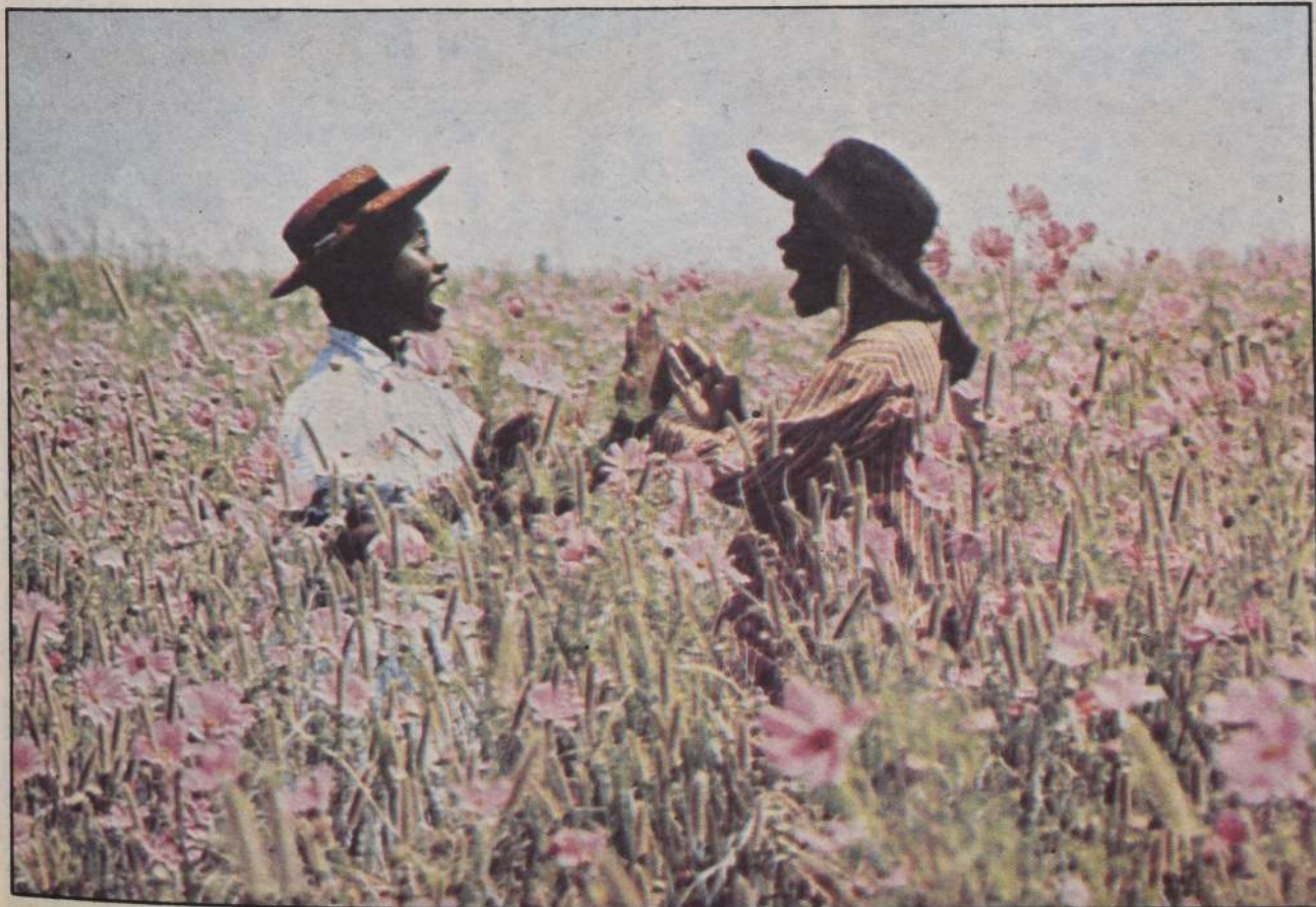
Todo el talento y los recursos que puede esgrimir el cine actual americano y Steven Spielberg fueron puestos al servicio de "El Color Púrpura" un filme que no tuvo la acogida merecida en la entrega de Oscar 86.

El filme más taquillero del año fue "REGRESO AL FUTURO", que vino con la canasta de Navidad del año anterior seguida de "ROCKY IV" de Sylvester Stallone. Factor importante que la popularidad de una película, en un año discreto en materia de afluencia de espectadores, fue su banda de sonido y sus éxitos en materia de discos o cassettes y en la fiebre de los video clips.