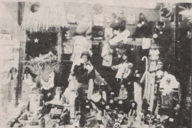
VENTAS NAVIDEÑAS. — Un fuerte aumento observaron las ventas del comercio registradas en los días previos a la Navidad, las que se incrementaron en forma significativa, según representantes del gremio.