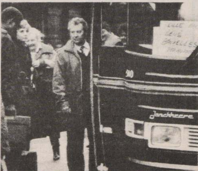
La radiofoto REUTER muestra los efectos provocados por la huelga ferroviaria de hace ya 11 días.

nistro Jacques Chirac, que propugna limitar los aumentos de paga para contener la inflación y promover la creación de fuentes de trabajo. El gobierno tuvo que ceder a principios de mes al descontento estudiantil y retiró un proyecto de reforma universitaria. La oficina de Chirac informó que el Primer Ministro canceló unas planeadas vacaciones esta semana y permanecería en París.