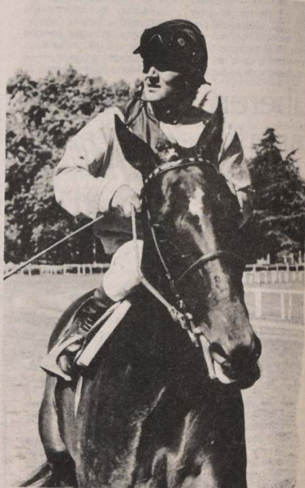
LOS NIÑOS fueron los que más disfrutaron con la jornada del Club Hípico. En las piletas durante la tarde y en la noche con los fuegos artificiales.

y demoró tanto su ataque final que incluso quedó cuarto en cierto momento