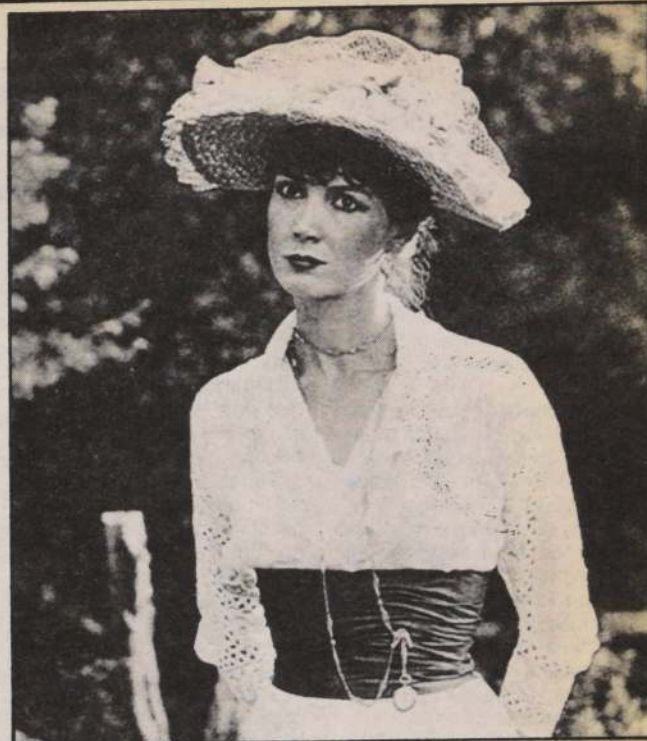
Enorme belleza plástica en esta crónica intimista de Bernard Tavernier llamada "Un domingo en el campo" con un fuerte y poco conocido elenco.

"GINGER Y FRED" , la sátira entre fustigante y comprensiva de un Federico Fellini adulto, pero vital. Esta vez se lanza contra la televisión, medio que conoce por sus célebres comerciales y algunos especiales. El terreno de los programas masivos y largaduración, con su atropello al ser humano y la búsqueda como "rating" seguro de lo anormal de los rasgos casi monstruosos y las faenas de los "iguales a". Marcello Mastroianni, genial en el rol de Fred (igual a Fred