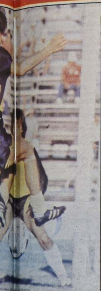
un contragolpe en el contragolpe. La... y traidora ventaja para los visitantes.