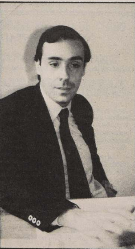
Trabajamos con toda la tecnología que podemos para mejorar nuestro rendimiento.