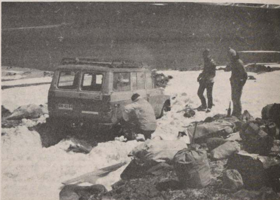
A. 4.700 metros de altitud, el vehículo queda atascado en la nieve. Se debe trabajar en forma intensa. Fue en noviembre cuando trece montañistas lograron la hazaña.

—“Nuestro objetivo principal es prestar el mejor servicio en la organización, promoción y ejecución de expediciones de montaña y