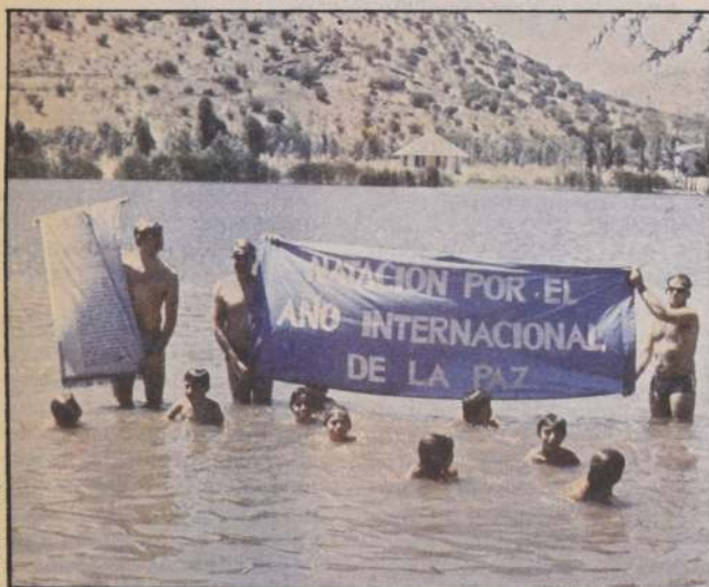
Los nadadores de la paz ya han cumplido su misión y en plena laguna Carén levantan su emblema que es un llamado para que toda la gente del mundo se adhiera a su campaña destinada hacer este mundo mejor.