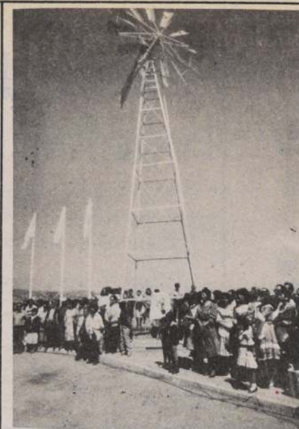
MOLINO PARA VALPARAISO.—

De acuerdo a antecedentes proporcionados por personeros de ASMAR la ingeniería del buque es enteramente nacional y fue desarrollada por profesionales de esa empresa. En su construcción se han utilizado sistemas de computación y equipos de alta tecnología.