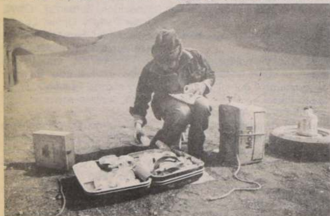
El doctor Boris Fuentes integrante del grupo de la Compañía de Guías de Montaña y Trekking, controla sus implementos médicos, piezas vitales en la hazaña realizada hace algunos días.