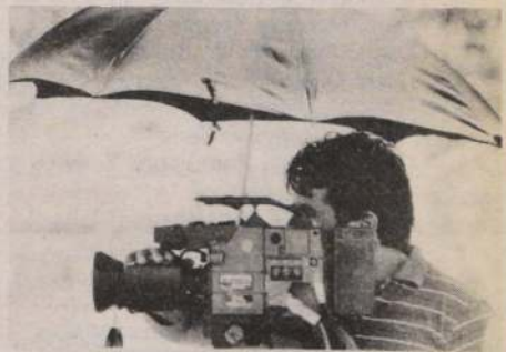
EL PARAGUAS. Los 32 grados que hicieron ayer en Santiago aguzaron el ingenio de todos en Santa Laura. Habla que protegerse de algún modo y, a la vez, resguardar los equipos. Este camarógrafo de TVN recurrió a un paraguas para trabajar sin problemas.