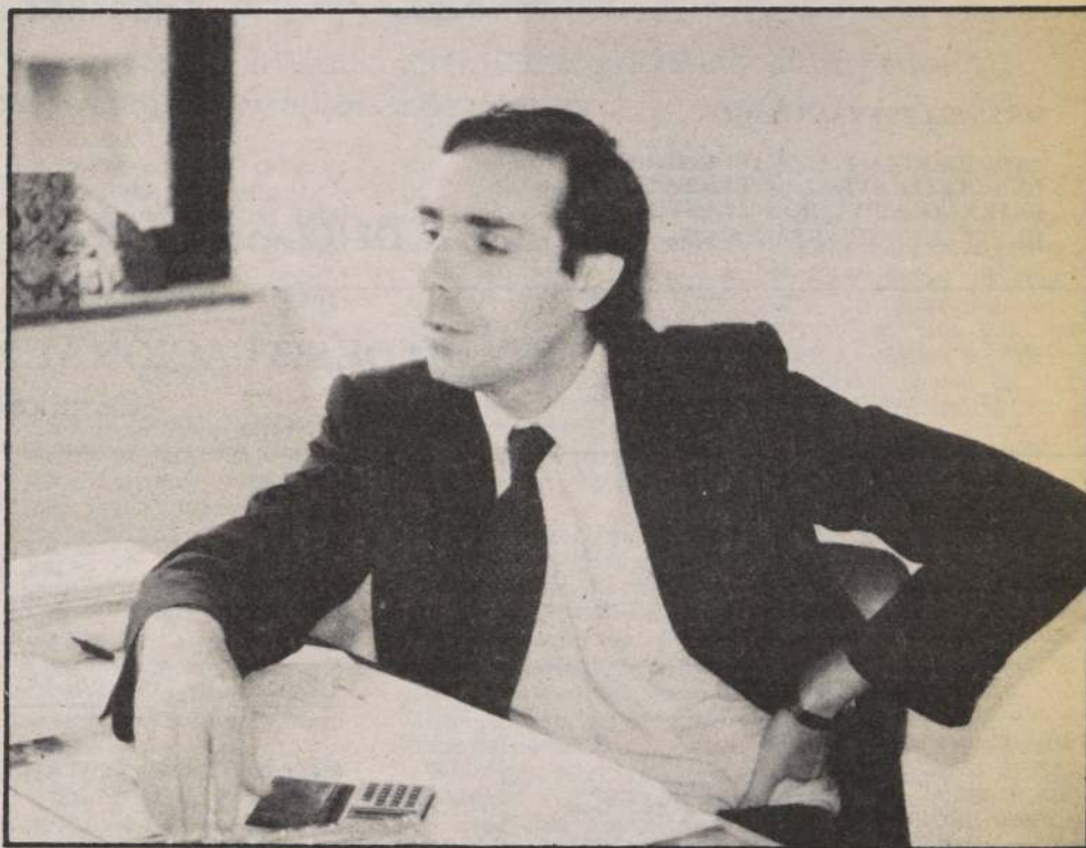
En algunos casos hemos obtenido tan buenos resultados, que nos hacen más optimistas para el futuro.

nos el mínimo necesario. Esto es, que todas las casas de la población estuvieran selladas, que no se llovieran y que el viento no se colara entre las maderas. Quiero destacar que esto se hizo con aportes privados y de los propios trabajadores, los que pusieron alrededor de un 30 por ciento de los fondos. Por otra parte, se está impulsando un programa de autoconstrucción, que esperamos que solucione el problema de la promiscuidad y falta de espacio. En todo esto los apoyamos consiguiéndoles materiales más baratos, que pueden pagar con facilidades, y dándoles asesoría.