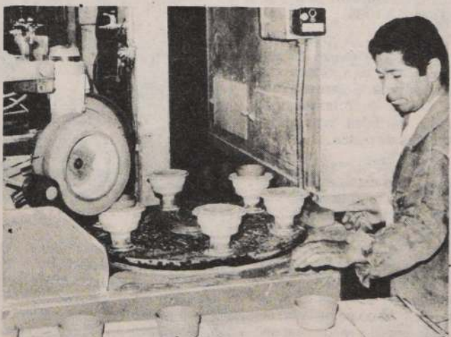
REPUNTE INDUSTRIAL. — Un crecimiento de un 8,3 por ciento experimentó la producción industrial entre enero y noviembre último, informó durante la semana la Sociedad de Fomento Fabril, SOFOFA.