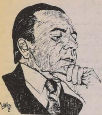
Carlos CRUZ-COKE OSSA