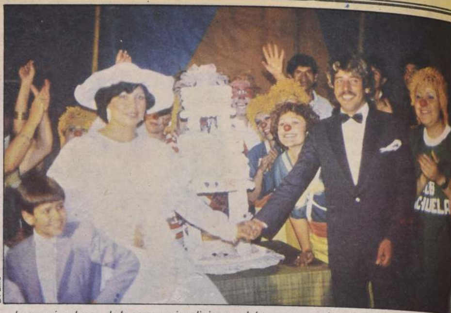
Los novios, luego de la ceremonia religiosa, celebraron su matrimonio en la carpa del circo Los Tachuelas, rodeados de sus compañeros de trabajo, que vistieron trajes muy de acuerdo con su labor de artistas circenses.

La presencia de la familia circense en la comuna de Quilicura, se debe a que las compañías de circo de todo el país, agrupadas en la Asociación Circense de Chile, se habían reunido en esa comuna para celebrar las fiestas de fin de año. Esta actividad se pudo realizar gracias al apoyo y acogida brindada por la alcaldesa de esa comuna. En la ocasión se reunieron miembros de 25 circos del país y se entregaron juguetes a 800 niños.