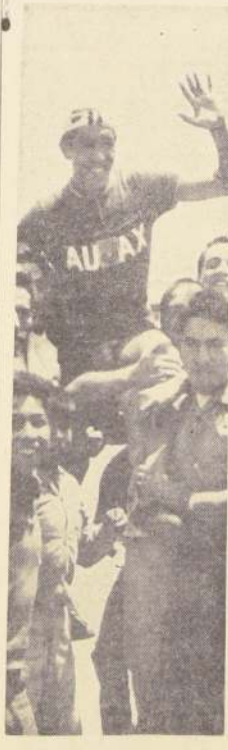
MANUEL GONZALEZ, actual campeón de Chile en Rutas.

Hoy, a las 18 horas, se cumplirá la primera fecha, con el siguiente programa: 2.000 metros para juveniles; australiana para novicios; 50 kilómetros para todo competidor; y octavos de final del campeonato de velocidad.