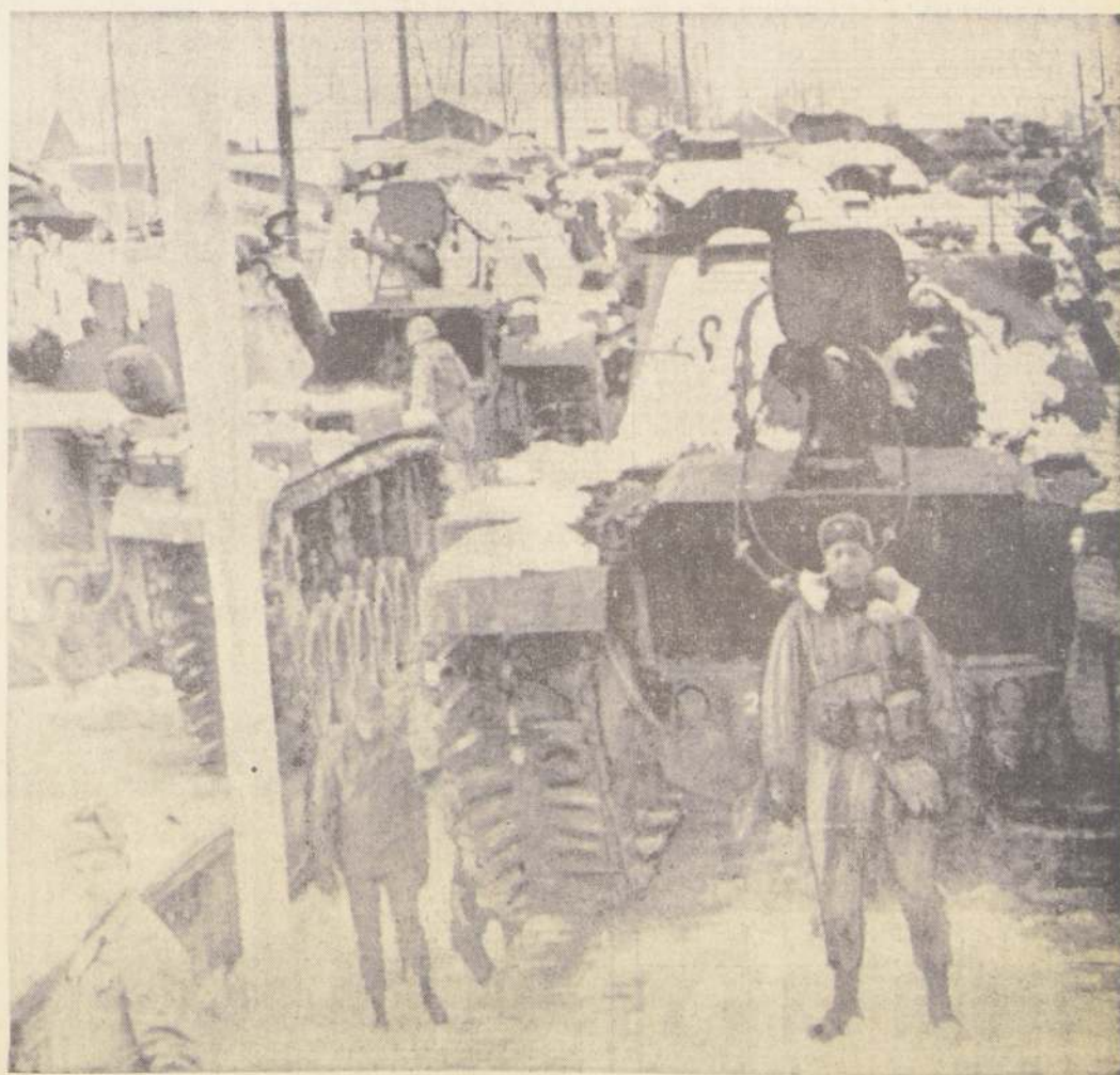
ALEMANIA.— Tropas de infantería norteamericanas llegan con pertrechos de combate para las maniobras militares que tendrán lugar en la frontera con Checoslovaquia el 29 de enero en curso. Quince mil soldados enviaron los Estados Unidos a estas maniobras.