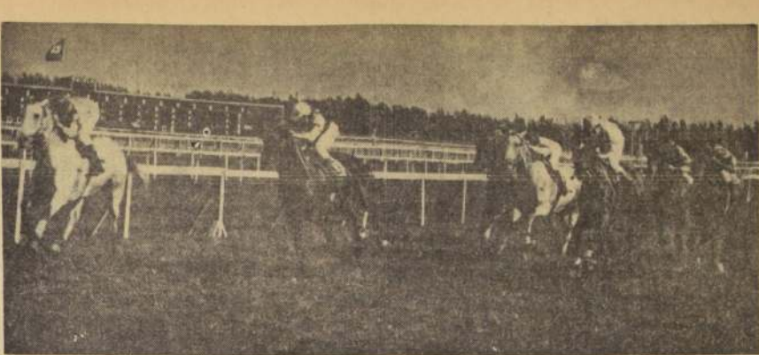
MAMBRINO se impuso, pese a los 59 kilos que cargaba, el más alto de todos los competidores, en la prueba central de la tarde. El segundo lugar fue para Ring, que atropello con grandes energías a la legada. Le Touquet y Vejestorio llegaron más atrás. Los "pesados", en esta carrera, cumplieron un buen papel.