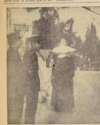
JERUSALEN.— La tensión que caracteriza las relaciones de jordanos e israelíes es posible de apreciar en los letreros colocados en la frontera entre ambos países en Jerusalén, que advierten: "Peligro. Tierra de nadie. Retírese". En el grabado, puede verse a dos policías israelíes montando guardia, en tanto que una religiosa espera el levantamiento de la barrera para salir a su casa, que viene de Jordania.