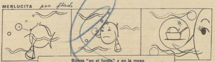
BUENA "en el fondo" y en la mesa

Mañana, a las 19 horas, se efectuará la ceremonia de inauguración del nuevo Servicio Asistencial con que cuenta el Círculo de Periodistas de Santiago.