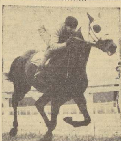
Solo tres rivales le salieron al paso a PAR DE ASES. El hijo de Paresa, que ahora defiende las sedas del "Chopac", corrará el próximo domingo los 2.000 metros del premio "Saint Leger".