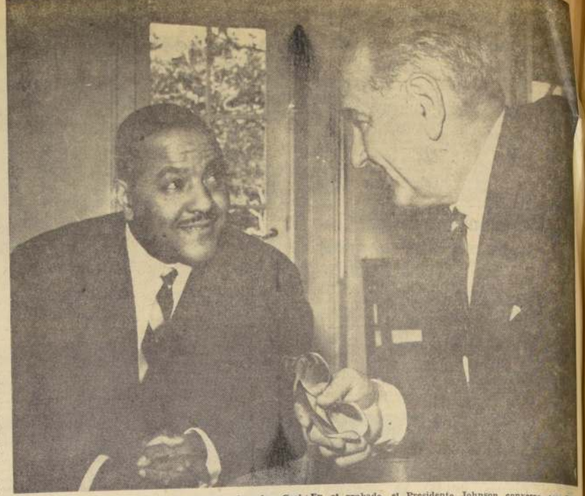
WASHINGTON.— Un diplomático y periodista de color, Carl T. Rowan, fue designado por el Presidente Lyndon B. Johnson para dirigir los servicios informativos de los Estados Unidos.

Los obreros de las industrias química y farmacéutica, que estimaban que los hechos demostraban que fue su esposo el que dio muerte al Presidente Kennedy.