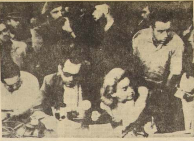
LA HABANA.— Fidel Castro, el Primer Ministro cubano (de pie, con una mano en la barbilla), y miembros de su Gobierno, aparecen en la conferencia ofrecida por el desiertor norteamericano Dennis Lee Kirby, quien no alcanza a aparecer en la fotografía. El joven pescador huyó de su país en una camaronera y entregó su embarcación al régimen de Cuba.— (RADIOFOTO UPL)

PARIS, 10.— (UPI).— Veinte de los 150 componentes del grupo de agricultores franceses radicados en Argentina, que han decidido radicarse en Argentina, salen hoy por avión para Buenos Aires. El grupo embarcará mañana en El Havre, en la motonave "Louis Lumière", para dirigirse a Buenos Aires en los primeros días de marzo. Los colonos se trasladarán a la zona de Formosa, en la provincia de Formosa, donde ya se encuentran radicados, según el mismo origen. A su salida de El Havre, los mineros serán despedidos por el General de Argentina, que con este fin se dirigirá al puerto y que saldrá al encuentro al doctor de Argentina, antiguo delegado de la UNESCO. A todo el "Louis Lumière".