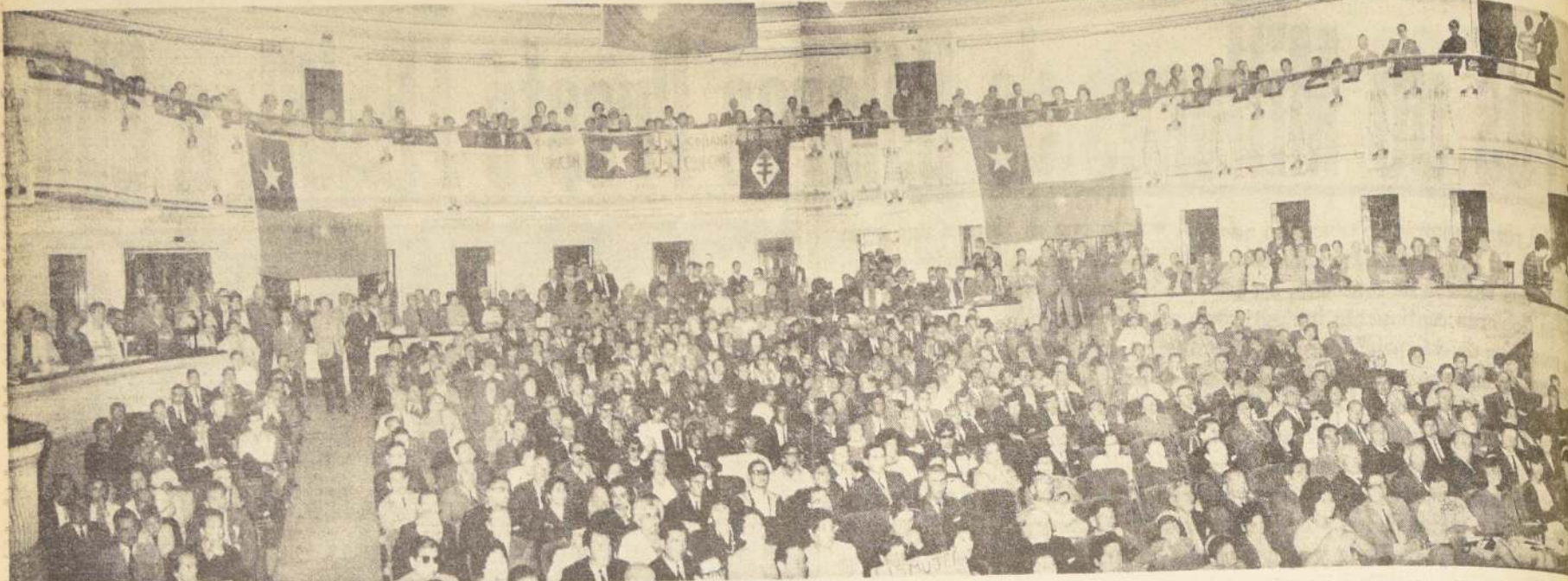
UN ASPECTO de la gigantesca concentración efectuada el domingo pasado en el Teatro Municipal de Viña del Mar,

EL SENADO • LA CAMARA • LAS COMISIONES • LOS PARTIDOS • LOS PROYECTOS • SU DISCUSION