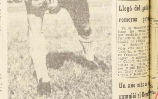
Llegó del extranjero el equipo de Valdivia, que fue castigado severamente por las autoridades peruanas del fútbol, ha tenido defensores y atacantes en Brasil, levantando polémicas.