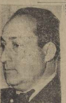
Don Rolando Merino, Ministro de Tierras

El ministro de Tierras, don Rolando Merino, declaró ayer que la Provincia de Aysen es una valiosa reserva agrícola para el país y que, por lo tanto, se levantará la carta fotogramétrica, se facilitará el crédito y se despertará en el país el interés por aquella apartada y promisoría región. El ministro declaró que los ocupantes de las tierras de Aysen recibirán títulos definitivos.